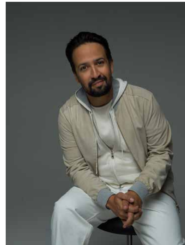
Lin-Manuel Miranda, autor musical de "Mufasa, The Lion King"

Miranda recalcó que hay un mensaje importante que espera que la gente se lleve de esta película: "Tengo dos hijos y están obsesionados con quién es el bueno y quién es el malo, como la mayoría de los niños. Ellos quieren entender el mundo. Lo que esta película te deja es poder tener una conversación con matices de que nadie nace siendo una buena persona. Nadie nace siendo una mala persona. Somos buenas y malas decisiones. A veces nuestras experiencias nos llevan a tomar las decisiones equivocadas. Somos buenos y malos impulsos y nadie es simplemente bueno o malo. Poder tener ese tipo de conversación con tus hijos, es muy alegre. Cuando una obra de arte permite esa conversación donde puedes, de alguna manera, utilizar estos personajes como una forma de hablar sobre el mundo real. Y creo que esta película lo hace maravillosamente"