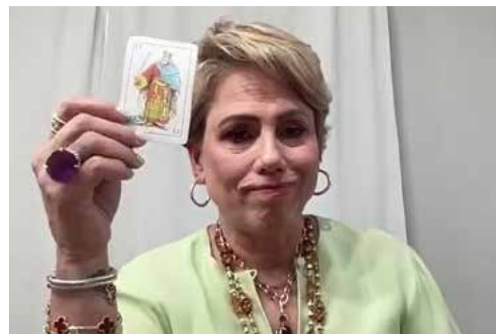
Bis la médium desde Miami durante la entrevista con Contacto Total. Aquí hablando sobre el futuro de Arizona.

¿Por qué para la gente es tan importante indagar sobre el futuro y que tan problemático puede ser cuando a una persona se le predice algo muy negativo?