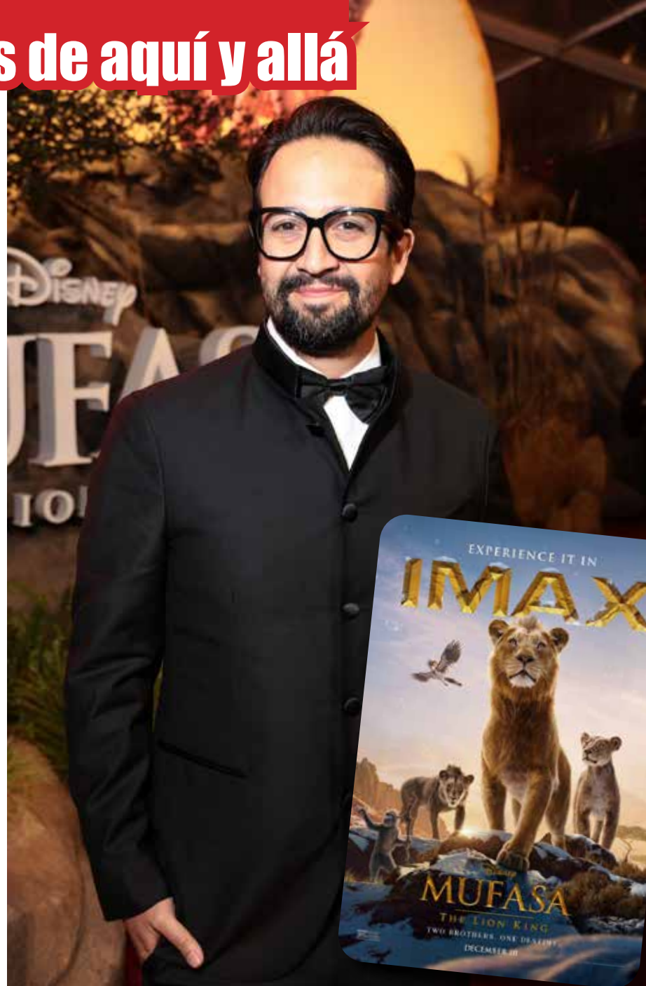
Lin-Manuel Miranda durante el estreno mundial de la película en el Teatro Dolby en Los Angeles.

Narrada en flashbacks, la historia presenta a Mufasa como un cachorro huérfano, perdido y muy solo hasta que conoce a un simpático león llamado Taka, el heredero de un linaje real. El encuentro casual pone en marcha un extenso viaje de un extraordinario grupo de inadaptados en busca de su destino. El nuevo largometraje combina técnicas cinematográficas de acción real con imágenes fotorrealistas generadas por computadora y como complemento perfecto, las canciones originales del galardonado compositor Lin-Manuel Miranda, la banda sonora original de