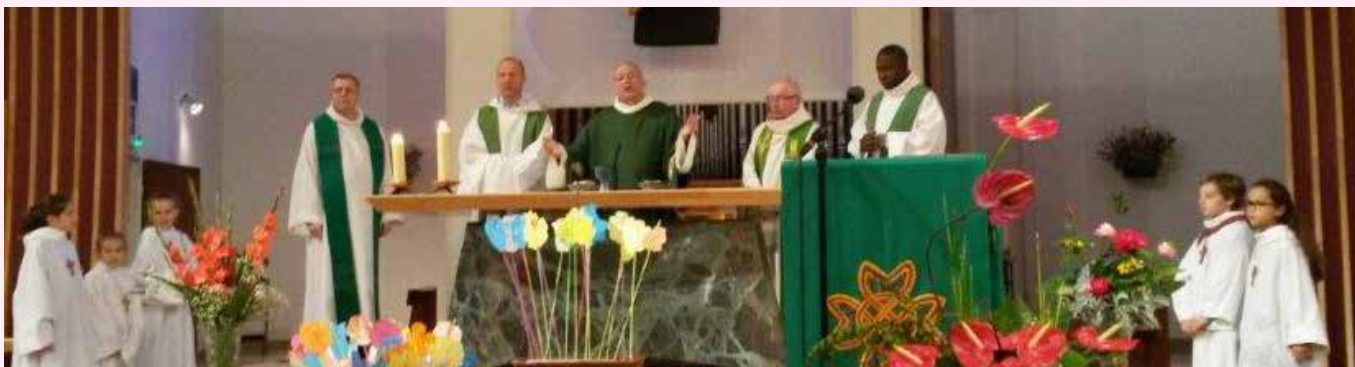
Célébration le jour de la fête paroissiale le 9 octobre.