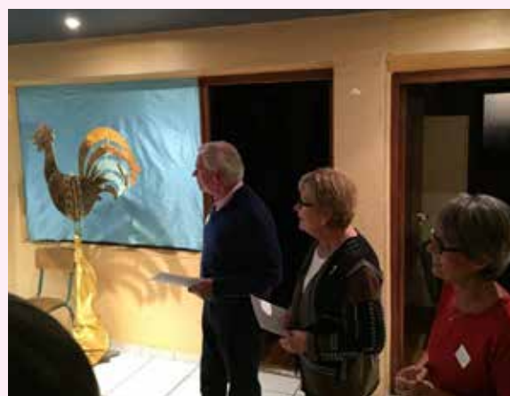
Animation autour du coq, lors du repas de la fête paroissiale, le 8 octobre..