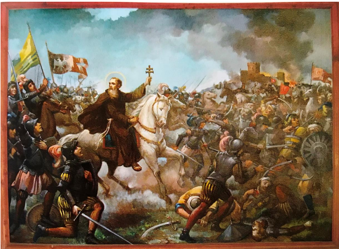
San Lorenzo da Brindisi nella battaglia di Albareale

Nell'iconografia laurenziana del resto, è più volte rappresentato il frate Lorenzo – padre Brindisi – sul campo di battaglia mentre incoraggia i soldati cristiani a resistere e a combattere contro l'esercito ottomano. Alcuni agiografi infatti, probabilmente particolarmente colpiti da quel singolare episodio, hanno voluto collocarlo al centro della vita di Lorenzo e così hanno addirittura finito col rappresentare il padre brindisino quasi come un generale alla testa del suo esercito che " Christiani nominis hostes, erecta Cruce, deterret ".