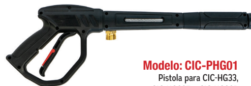
Modelo: CIC-PHG01 Pistola para CIC-HG33, CIC-HG66E y CIC-HG80P