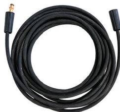
Modelo: CIC-MHE02 Manguera para CIC-HE12400