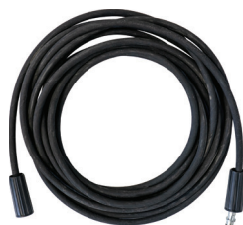
Modelo: CIC-MHE01 Manguera para CIC-HE9400 y CIC-HE10400