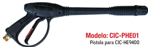
Modelo: CIC-PHE01 Pistola para CIC-HE9400 CIC-HE10400 CIC-HE12400