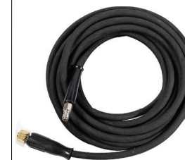
Modelo: CIC-MHG02 Manguera para CIC-HG140P