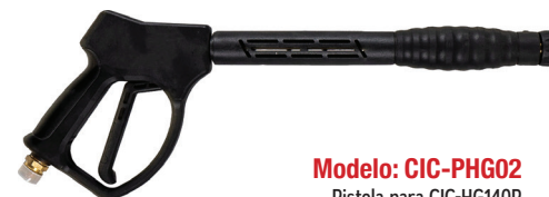
Modelo: CIC-PHG02 Pistola para CIC-HG140P