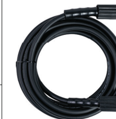
Modelo: CIC-MHG01 Manguera para CIC-HG33, CIC-GH66E y CIC-HG80P