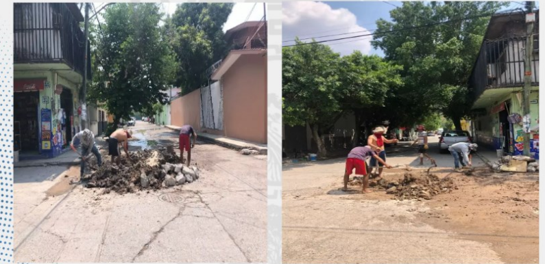
Personal del área operativa de este Organismo, llevó a cabo la reparación de una tubería dañada en la Col. Vicente Guerrero, debido a que se presentaba una fuga de agua.