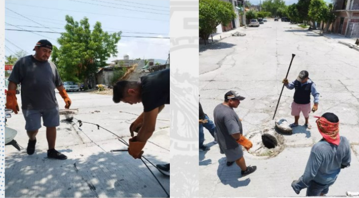
Personal del área operativa de este Organismo, llevó a cabo el desazolve de drenaje en la Col. Patria Nueva, debido a que se encontraba tapado.