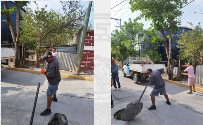
Personal del área operativa de este Organismo, llevó a cabo el desazolve de drenaje en la Colonia Heberto Castillo, debido a que se encontraba colapsado.