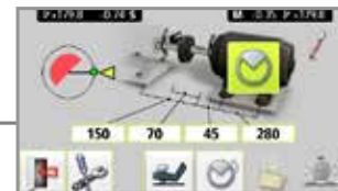
Repetir la medición