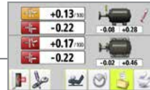
Evaluar los resultados