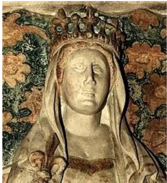
Margherita di Durazzo - Madre di Ladislao