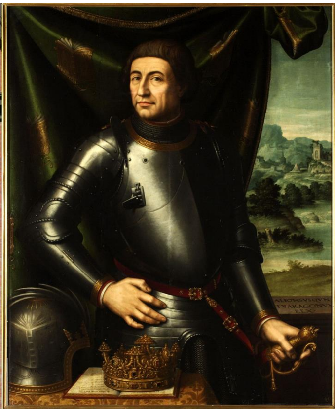
Alfonso V di Aragona: I° re aragonese del Regno di Napoli dal 1442 al 1458