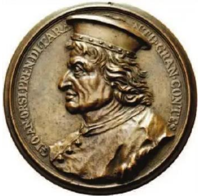
Giovanni Antonio Orsini Del Balzo principe di Taranto dal 1420 al 1463