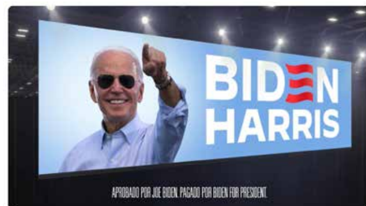
Gooooo!!! | Biden-Harris 2024

Aquí en Arizona, el representante demócrata de Arizona y candidato al senado Ruben Gallego, acaba de anotar no uno, sino dos goles con su nueva campaña publicitaria. Es su primer anuncio de televisión en español, donde