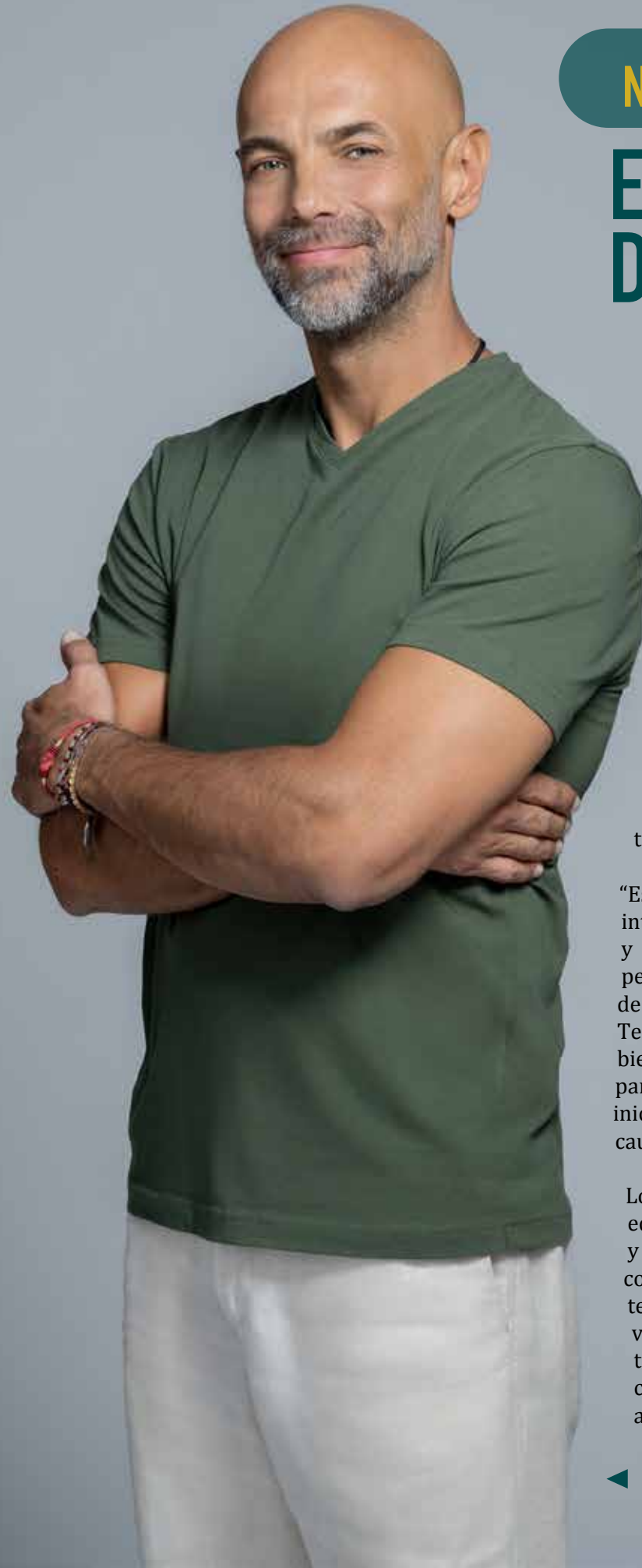
◀ Javier Poza presentador de La Isla: Desafío extremo

Store y en Apple Store, o visitando Telemundo.com. Los episodios también estarán disponibles en el servicio de streaming Peacock.