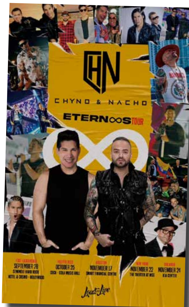
Fotografía: Eternos tour

Boletos a la venta el viernes 28 de junio por www.eternostour.com