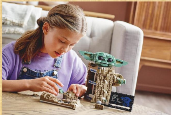
Jeux de construction