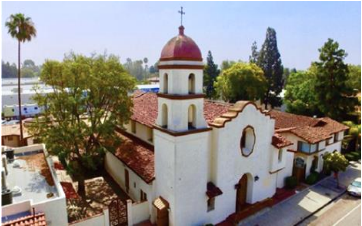
La Chiesa fondata nel 1908 sulla Compton Avenue nel cuore di Watts a Los Angeles Nel 1922, i frati Cappuccini la rifondarono intitolandola a San Lorenzo da Brindisi