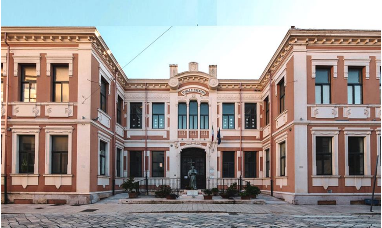
Scuole Elementari San Lorenzo a Brindisi dal 1922