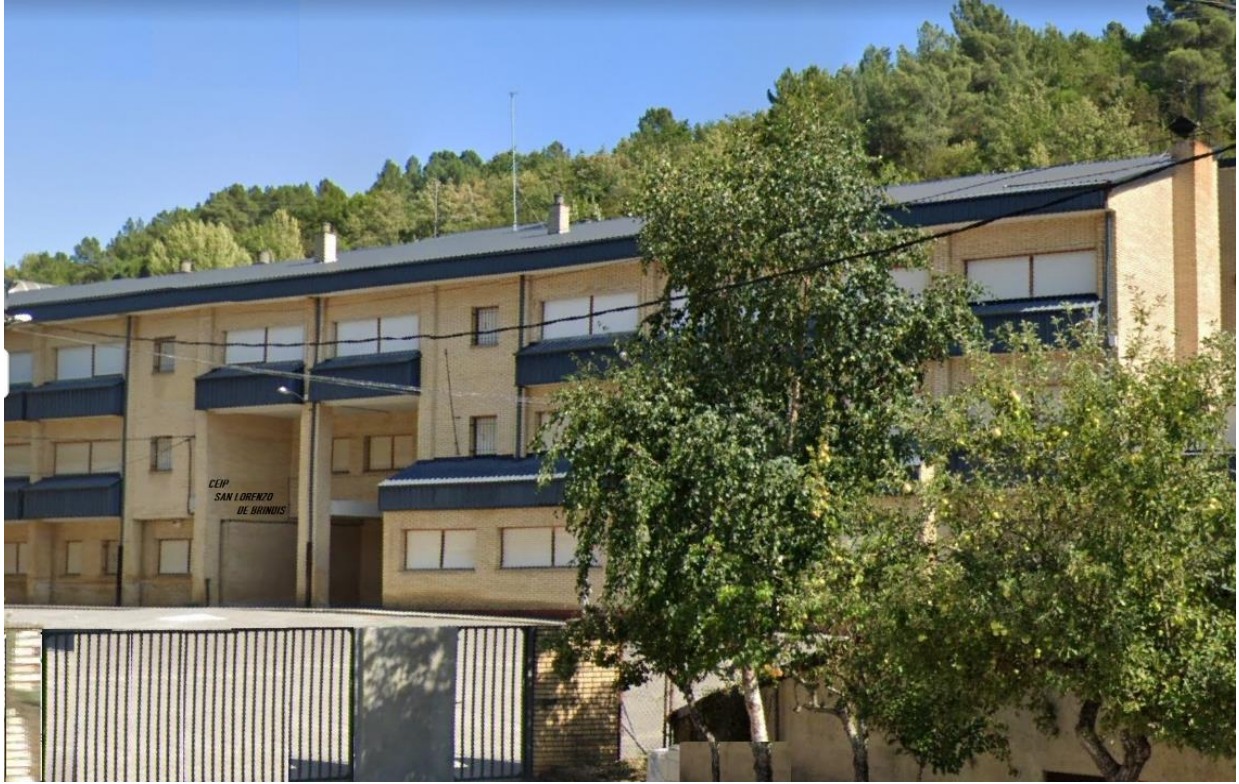
La Scuola Elementare san Lorenzo de Brindis in Villafranca del Bierzo – Leòn Spagna