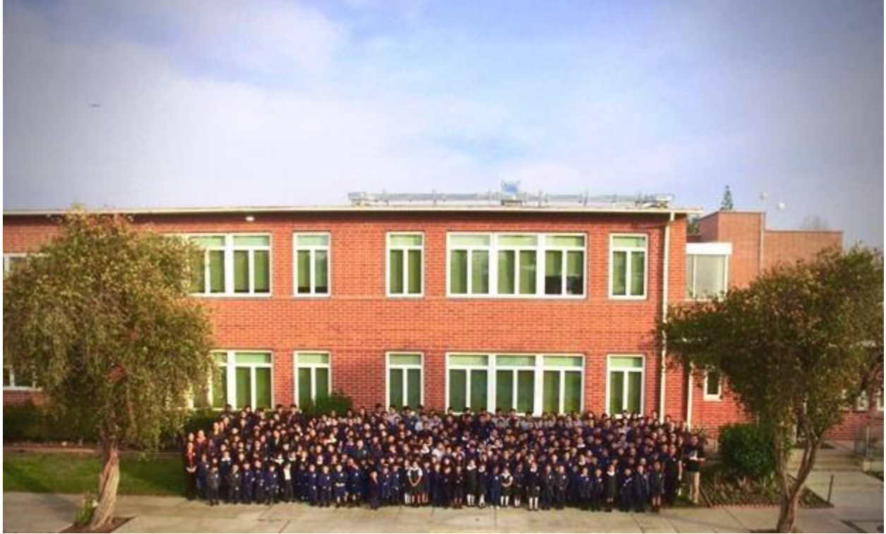
La "Saint Lawrence of Brindisi Catholic School" a Los Angeles dal 1924