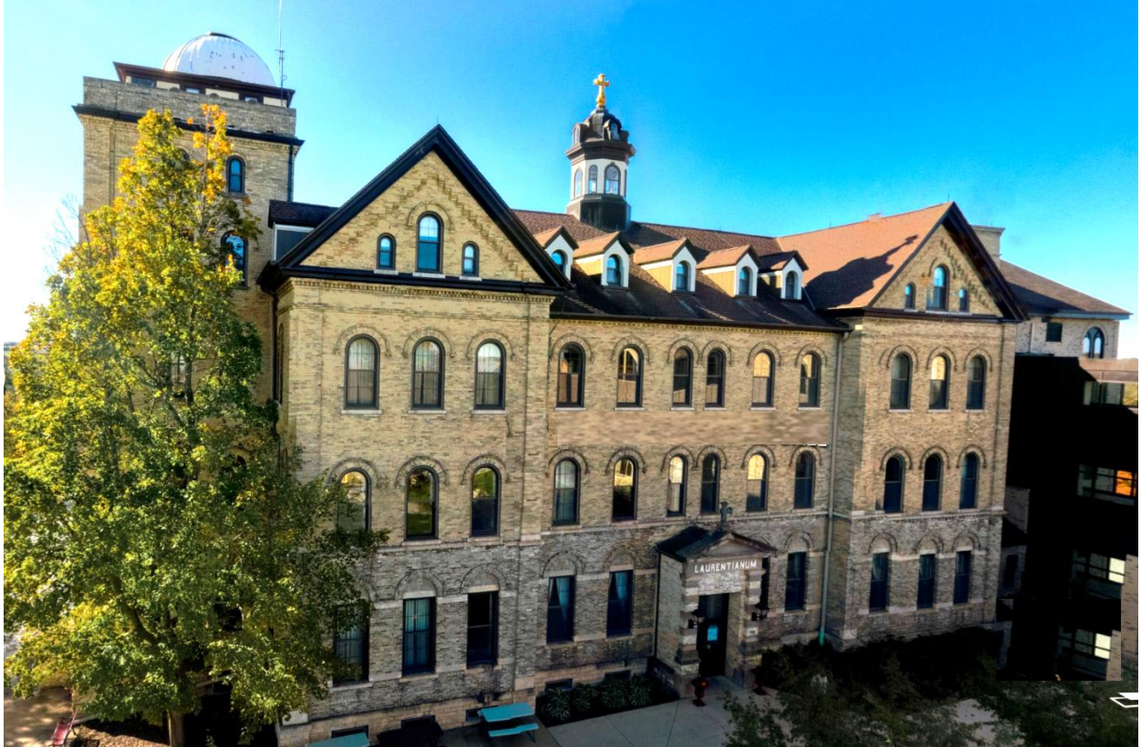
Il "St. Lawrence of Brindisi High School" di Mount Calvary, nel Wisconsin – fondato nel 1860