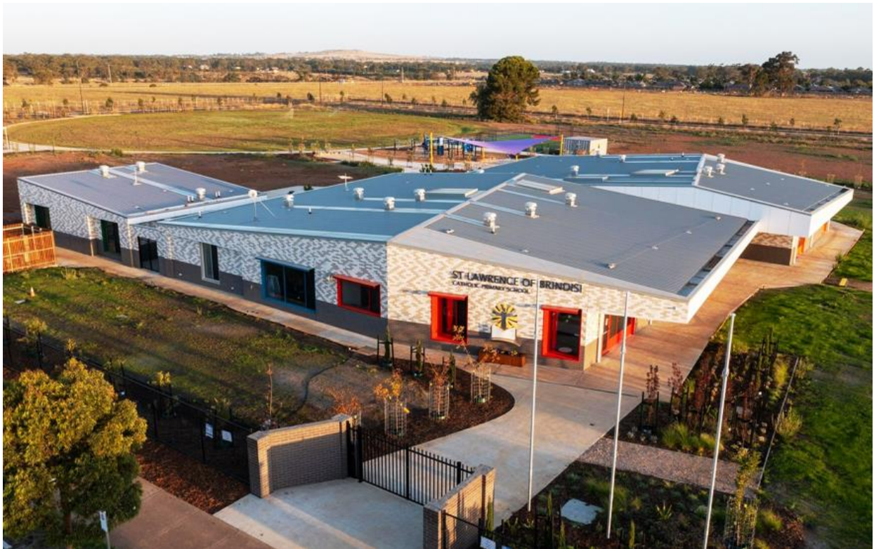
St Lawrence of Brindisi Catholic Primary School - Weir Views, Melton Australia