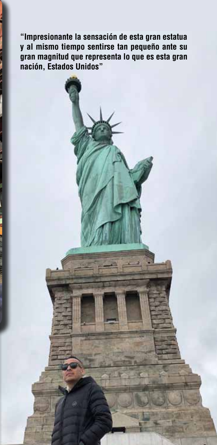
“Impresionante la sensación de esta gran estatua y al mismo tiempo sentirse tan pequeño ante su gran magnitud que representa lo que es esta gran nación, Estados Unidos”