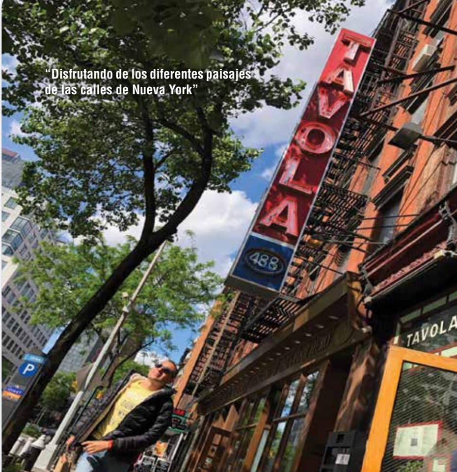
“Disfrutando de los diferentes paisajes de las calles de Nueva York”