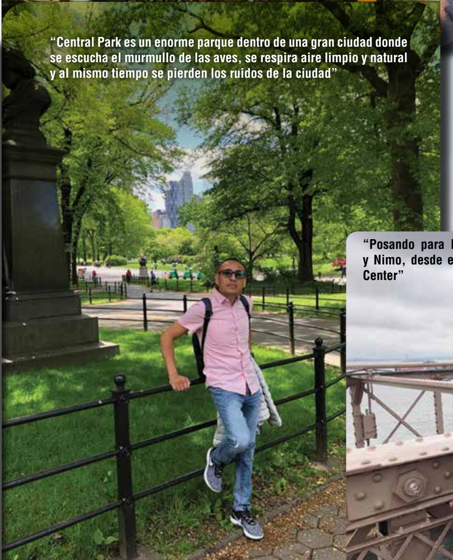
“Central Park es un enorme parque dentro de una gran ciudad donde se escucha el murmullo de las aves, se respira aire limpio y natural y al mismo tiempo se pierden los ruidos de la ciudad”