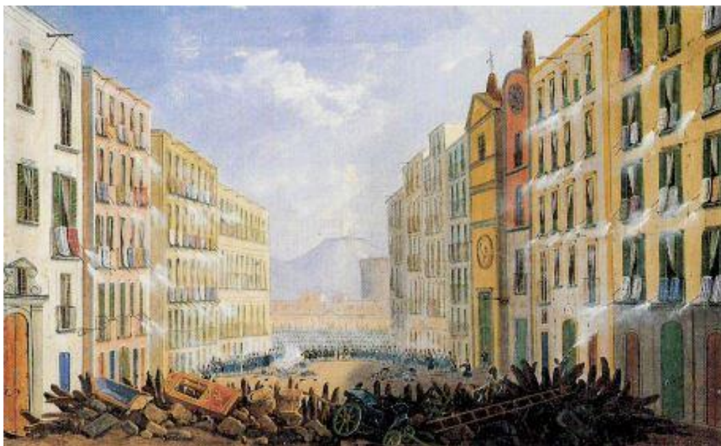
Le barricate in via Santa Brigida a Napoli il 15 maggio 1848

In quel frangente storico di metà '800, quindi, furono varie decine i brindisini che pagarono molto pesantemente – alcuni di loro con la vita – la loro decisa adesione agli ideali della libertà e della giustizia e alla lotta contro l’oppressione e l’ingiustizia. Tutti loro coraggiosi brindisini che, seguendo da vicino quei loro concittadini che solo mezzo secolo prima avevano iniziato quella stessa battaglia contro quello stesso nemico, dovevano ben presto – molti di loro – presenziare quella che nel 1861 sembrò essere stata la vittoria. Purtroppo però, si trattò di una vittoria molto dubbia, forse neanche pirrica e, comunque, non certo risolutiva.