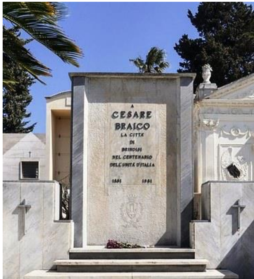
Tomba di Cesare Braico nel cimitero di Brindisi