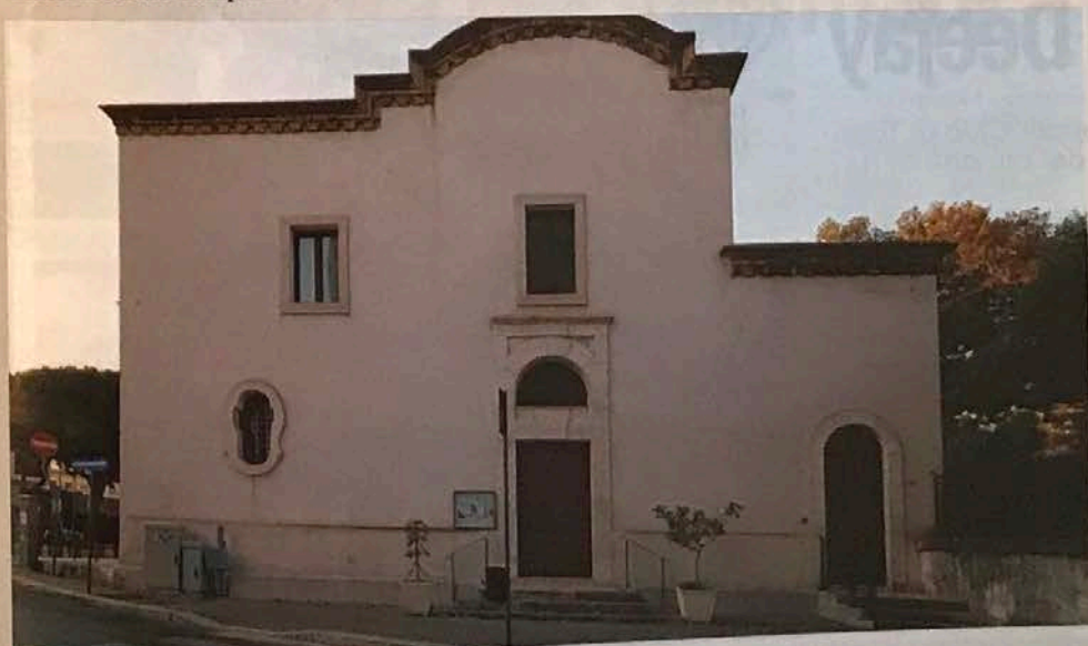
La chiesa oggi

L'insegnamento delle discipline agricole, invece, da Brindisi migrò e si radicò, del tutto e per sempre, a Ostuni.