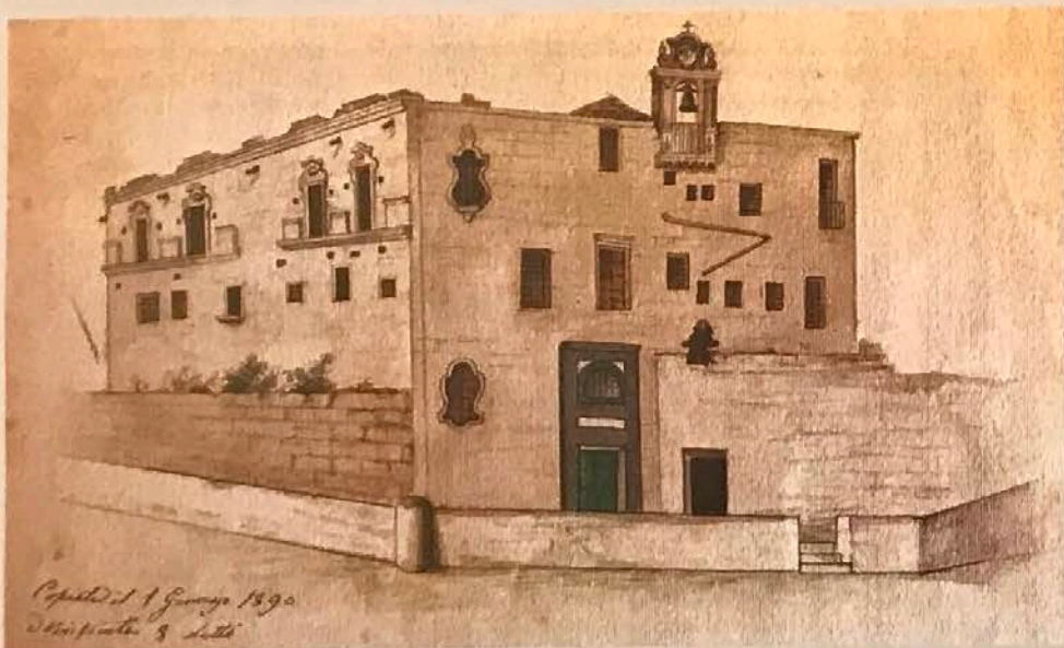
La chiesa dei Cappuccini nel 1890 quando era Istituto Agrario

La chiesa, chiusa al pubblico culto dopo la soppressione del 1861, riprese a funzionare per