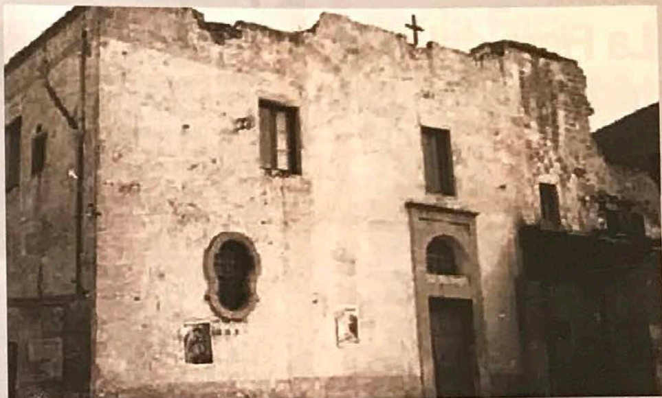
La chiesa del Cappuccini nel 1945

Durante i bombardamenti inglesi subiti da Brindisi nella seconda guerra mondiale, la chiesa rimase severamente danneggiata con la completa distruzione del campanile e solo nel 1955 fu ri-