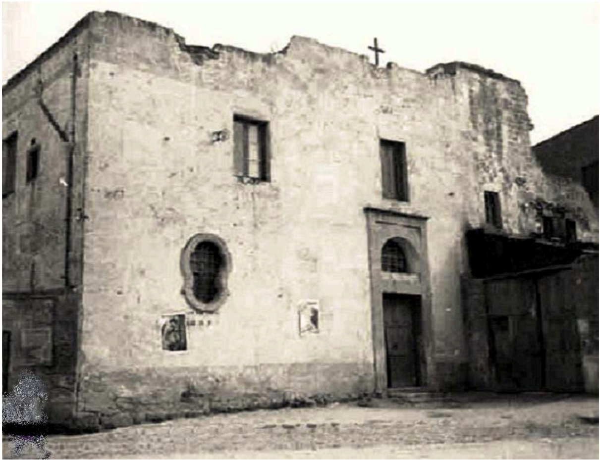
sopra: La Chiesa nel 1945 – sotto: la Chiesa restaurata nel 2007