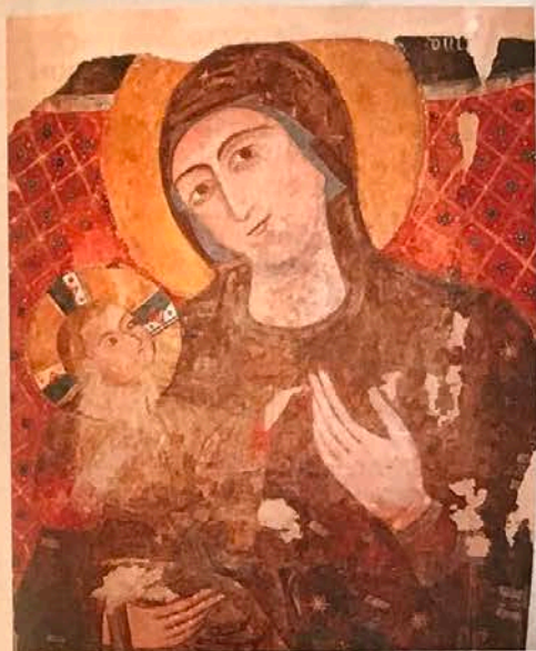
La Madonna della Fontana