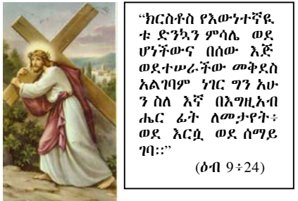
“ክርስቶስ የእውነተኛዬ ቱ ድንኳን ምሳሌ ወደ ሆነችውና በሰው እጅ ወደተሠራችው መቅደስ አልገባም ነገር ግን አሁን ስለ እኛ በእግዚአብሔር ፊት ለመታየት፡- ወደ እርሷ ወደ ሰማይ ገባ።” (ዕብ 9፥24)

“እነሆ ድንግል ትግንላለች ፤ ወንድ ልጅም ትወልዳለች፤ ስሙም 'ዐማኑኤል' ተብሎ ይጠራል።” ዐማኑኤል ማለትም “እግዚአብሔር ከእኛ ጋር ነው” ማለት ነው። (የማቴዎስ ወንጌል 1፥23 አ/ት)