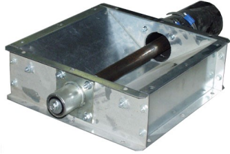
Entrada baja, diseñada para pellets y biomasa similar