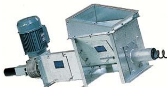
Motor conectado a la salida

Los sinfines flexibles BM establecen un transporte directo y eficiente entre el silo y la caldera o entre el lugar de descarga y el silo