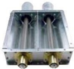
Entrada baja, diseñada para pellets y biomasa similar capaz de alimentar dos calderas.