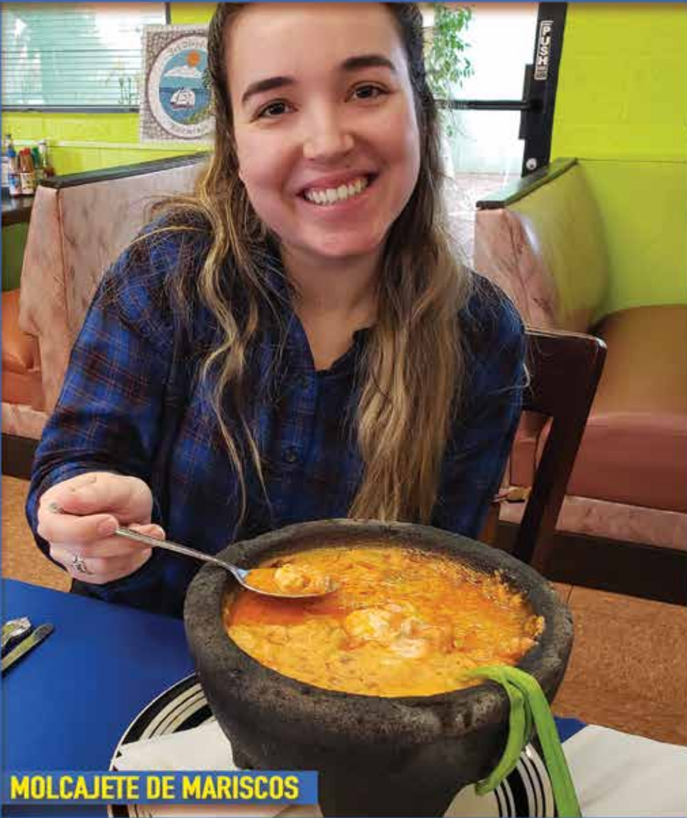
MOLCAJETE DE MARISCOS