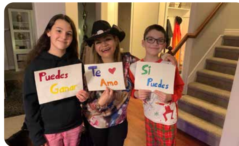
Lleva 14 años felizmente casada. Su esposo y sus dos hijos siempre apoyándola.

Después de su paso por Tengo Talento mucho Talento y de estar en pausa debido a la pandemia, Betty quiere apoderarse de los escenarios y lanza una convocatoria a todos los promotores y ofrece su show con mariachi y con banda. Actualmente ya tiene varias ofertas. Por lo pronto abrirá conciertos con Ezequiel Peña. Y espera estar pronto en el Rancho Corona con su público de Arizona. “Eso me encanta porque Ezequiel tiene un show muy bonito ecuestre”