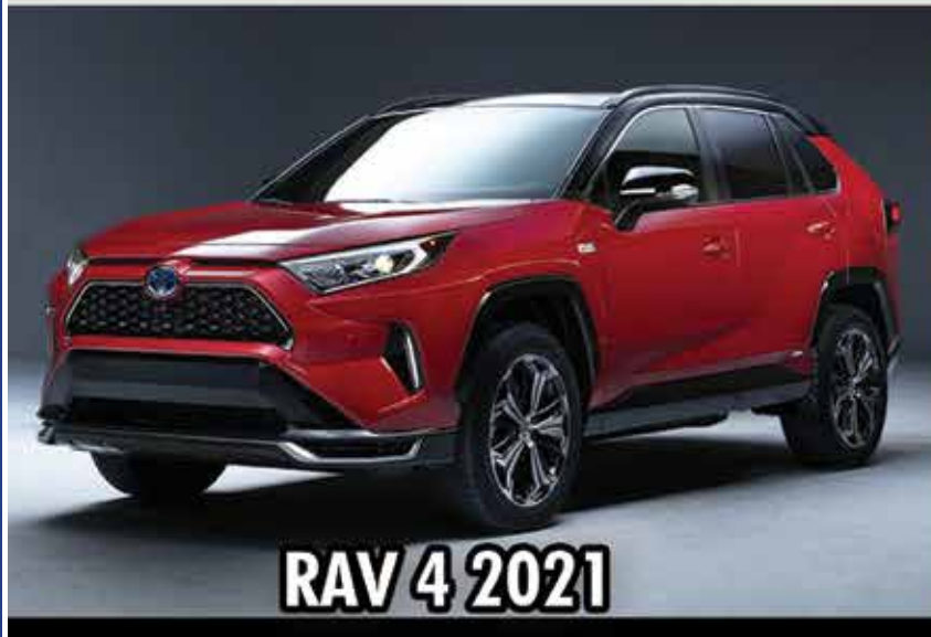
RAV 4 2021