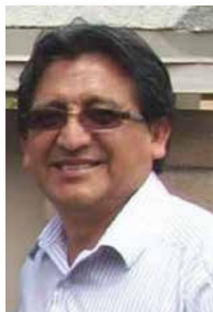
Por FRANCISCO JAUREGUI

El Perú, como estamos conociendo en esta serie de artículos, tiene una riqueza cultural y diversa gama de interpretaciones artísticas, que están siendo difundidas en el exterior, y particularmente en el estado de Arizona, por destacados compatriotas que han compartido lo mejor de la música y las danzas de nuestro país. Así mismo, hay quienes se han unido o formado algunos grupos musicales donde han fusionado con la música de otros países, tal es el caso del grupo musical “Guitarras Latinas”, que se estableció en el 2006.