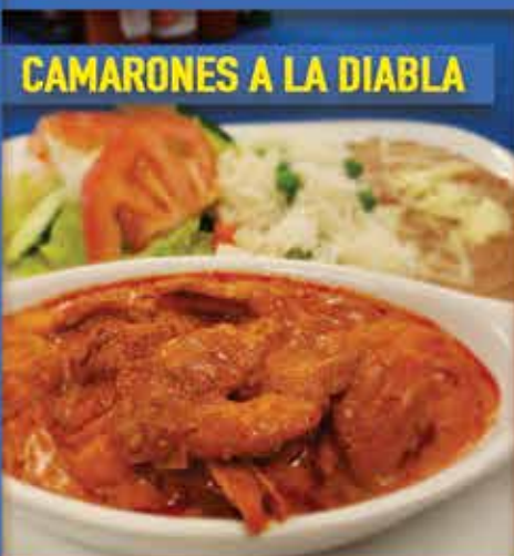
CAMARONES A LA DIABLA

ABRIMOS TODOS LOS DÍAS 9201 S. Avenida del Yaqui Guadalupe, AZ 85283 480-839-2991 www.sandiegobayseafood.com