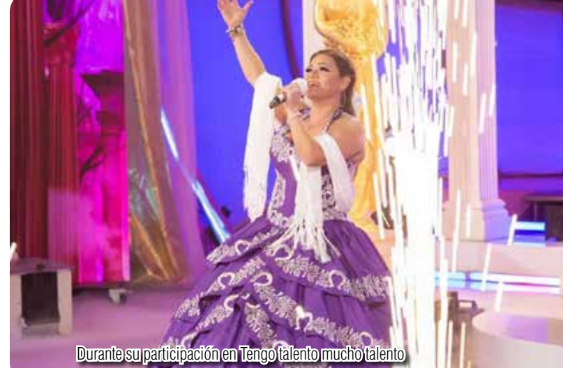
Durante su participación en Tengo talento mucho talento