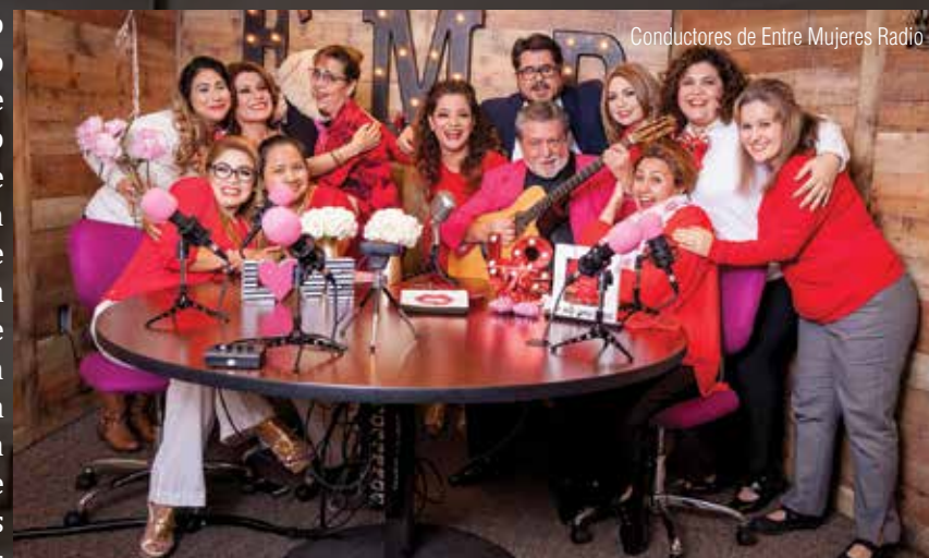
Conductores de Entre Mujeres Radio

Creo que el momento más difícil fue el inicio del proyecto porque iba a ser lanzado como un solo programa de radio y una cuestión de registro de nombre nos dio la pauta para saber que tenía que ser más grande que un solo programa, tenía que ser una plataforma de 24 horas al aire para ofrecer espacios disponibles a todas las personas que estuvieran dispuestas a incursionar en el medio de la radiodifusión.