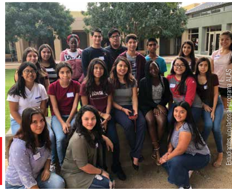
Estudiantes vinculados al programa ALAS

tenemos más gente preparada y con la educación necesaria, vamos a poder tener más líderes en mesas importantes que deciden el futuro de nuestra comunidad.