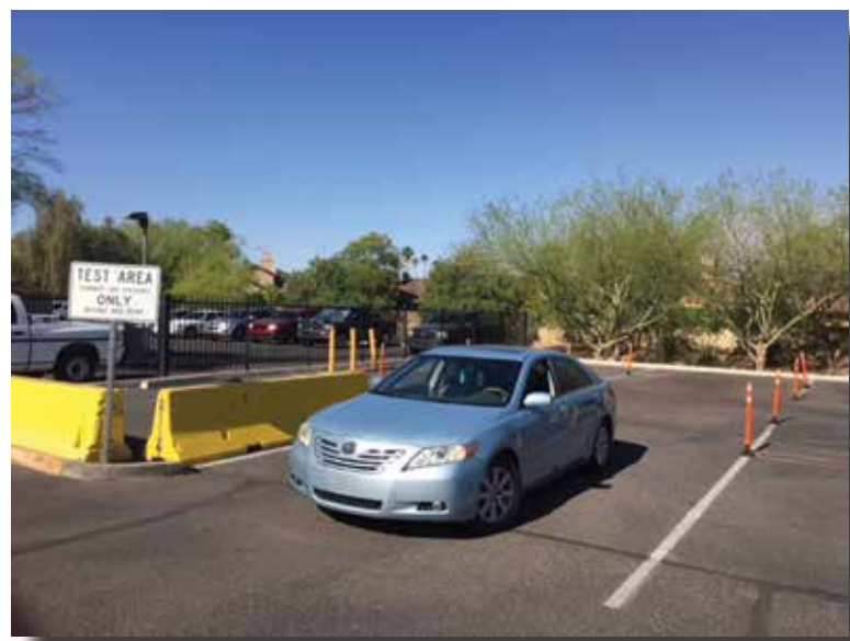
Área donde se lleva a cabo el examen de manejo en una oficina de MVD

Si tiene preguntas comuníquese conmigo al 602-712-8989.