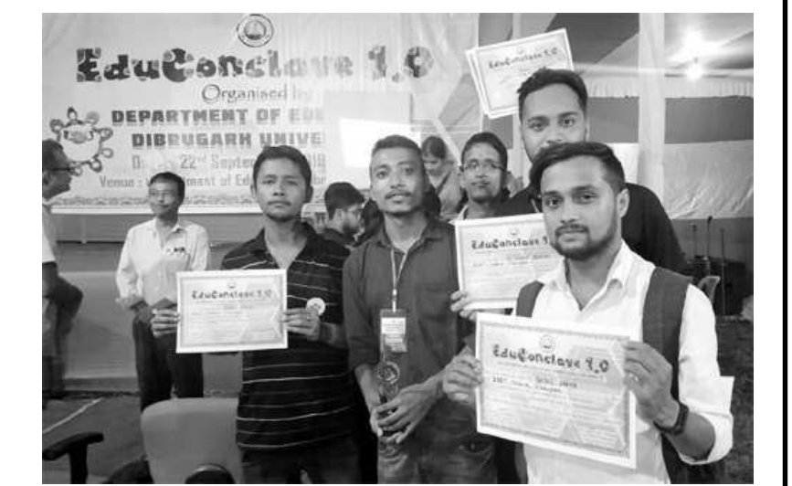
ডিব্ৰুগড় বিশ্ববিদ্যালয়ৰ শিক্ষাতত্ব বিভাগৰ 'Educonclave 1.0'ৰ দ্বাৰা আয়োজিত আন্তঃ বি.এড. কলেজ কুইজ প্ৰতিযোগিতাত তৃতীয় স্থান দখল কৰি শিক্ষানুষ্ঠানলৈ সুনাম কঢ়িয়াই আনিবলৈ সক্ষম হোৱা দলটি।