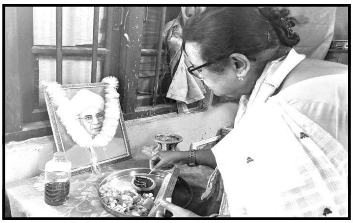
৫ ছেপ্টেম্বৰ, ২০১৯ ঃ প্ৰতিষ্ঠানৰ অধ্যক্ষা, শৈক্ষিক বিষয়া, কৰ্মচাৰী আৰু প্ৰশিক্ষাৰ্থী সকলৰ সহযোগিতাত আড়ম্বৰপূৰ্ণভাৱে শিক্ষক দিৱস উদ্যাপন কৰা হয়।