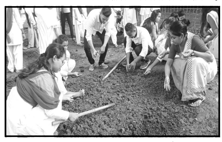
২৫ ছেপ্টে স্বৰ-১০ অক্টোবৰ, ২০১৯ ঃ ডি.এল.এড. তৃতীয় যান্মাসিকৰ প্ৰশিক্ষাৰ্থী সকলৰ দ্বাৰা প্ৰতিষ্ঠানৰ চৌহদত ফুলনি বাগিছা স্থাপনৰ কাৰ্যসূচীৰ সফল ৰূপায়ন।