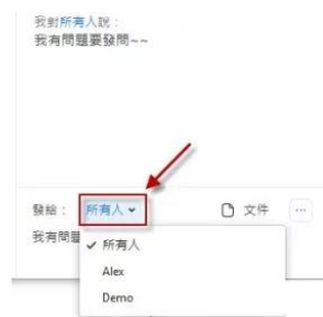
可以另外選擇要公開所有人看的到，還是私訊某人