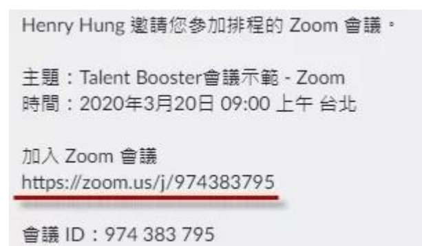
常見的 Zoom 會議邀請

一般來說，你會收到如下圖的會議邀請。例如一串由 zoom.us/j/123456789 共九碼的網址。