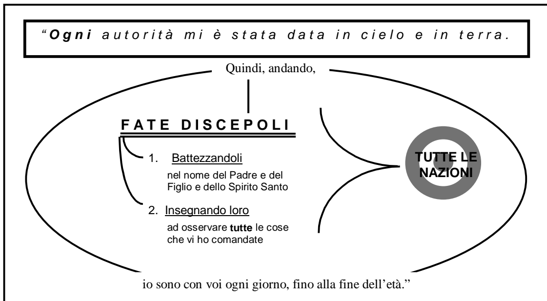
Immagine 2.1 Il Grande Mandato