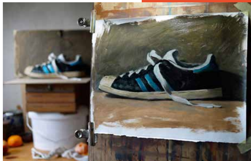
Yann Hovadik, Tranche de pastèque. 16 x 26 cm.

10 RECOMMENCER : Élaborez différentes compositions à partir des mêmes objets. Modifiez l'arrangement (mettez en valeur l'un puis l'autre objet), l'éclairage, le fond, l'environnement, ajoutez un détail, etc. Les possibilités sont illimitées !