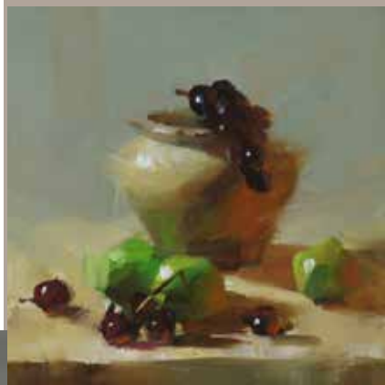
Dust and Stripes Huile sur toile 84 x 155 cm. Dust and Stripes Huile sur toile 84 x 155 cm.