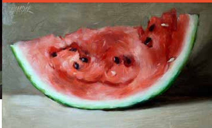
Yann Hovadik, Tranche de pastèque. 16 x 26 cm.