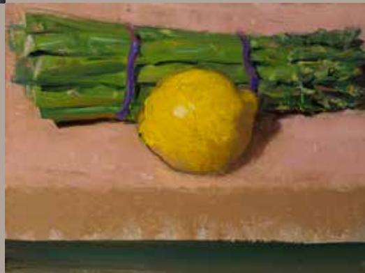
Lemon and Asparagus. Huile sur toile 84 x 155 cm. Dust and Stripes Huile sur toile 84 x 155 cm.

C'est dans la tête de Duane Keiser qu'a lentement pris forme l'idée du Daily Painting. Au début des années 2000, cet adepte des peintures de petit format (« premier coup painting ») qui dépeignent des petits moments de sa vie, était à la recherche d'un moyen d'écouler ces mini-peintures dénigrées par les galeries. Il décide d'organiser des soirées portes ouvertes où il propose ses « peintures cartes postales » à prix unique ($100). Petit à petit, sa réputation grandissant et son carnet d'adresses mail s'élargissant, il décide de vendre ses œuvres directement via e-mail au premier offrant. Surfant à la fois sur l'émergence des réseaux sociaux et la tendance pour un art « abordable », il attire ainsi une nouvelle catégorie d'acheteurs qui préfèrent la petite toile originale au poster sous-verre. De là naît en 2004 l'idée du blog avec newsletter et la décision de créer une peinture par jour afin de nourrir ce blog. Il ne manquait plus que la suggestion d'un ami d'y attacher un site d'enchères afin de faire monter les prix et le concept de « A Painting A Day » (« une peinture par jour ») était né.