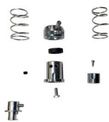
Quick release kit (optional)