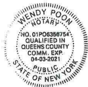
Stamp, Notary Public