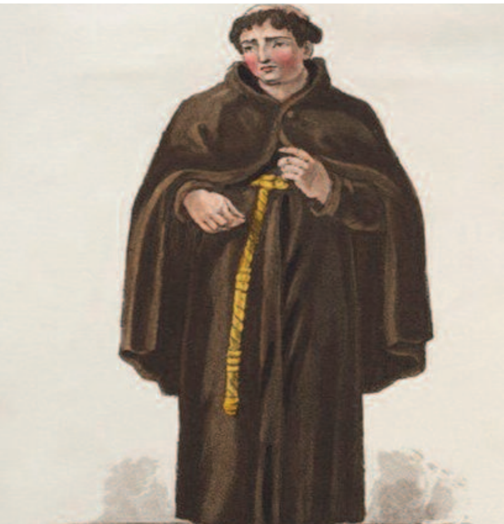
LE IMMAGINI Un ritratto di padre Bernardo Selvaggi, frate brindisino del Seicento

Bisogna infatti aggiungere – obiettivamente e a suo favore – ch’egli probabilmente, se non fu solo intuito, ebbe la perspicacia d’aver studiato ed aver compreso molto bene il suo secolo, con tutti i suoi vizi e con le sue virtù, e avendone notato la depravazione in fatto di gusto letterario, pur di ottenere lo scopo di far penetrare nelle menti del popolo la verità della sua fede, rivestiva ad arte le verità medesime di quella forma letteraria, e probabilmente non solo quella, che più si aggiustava al gusto popolare dell’epoca.