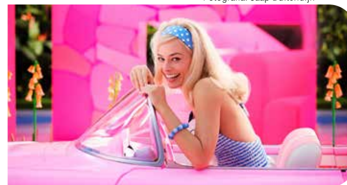
CONTACTO TOTAL LA REVISTA QUE HABLA N° 138