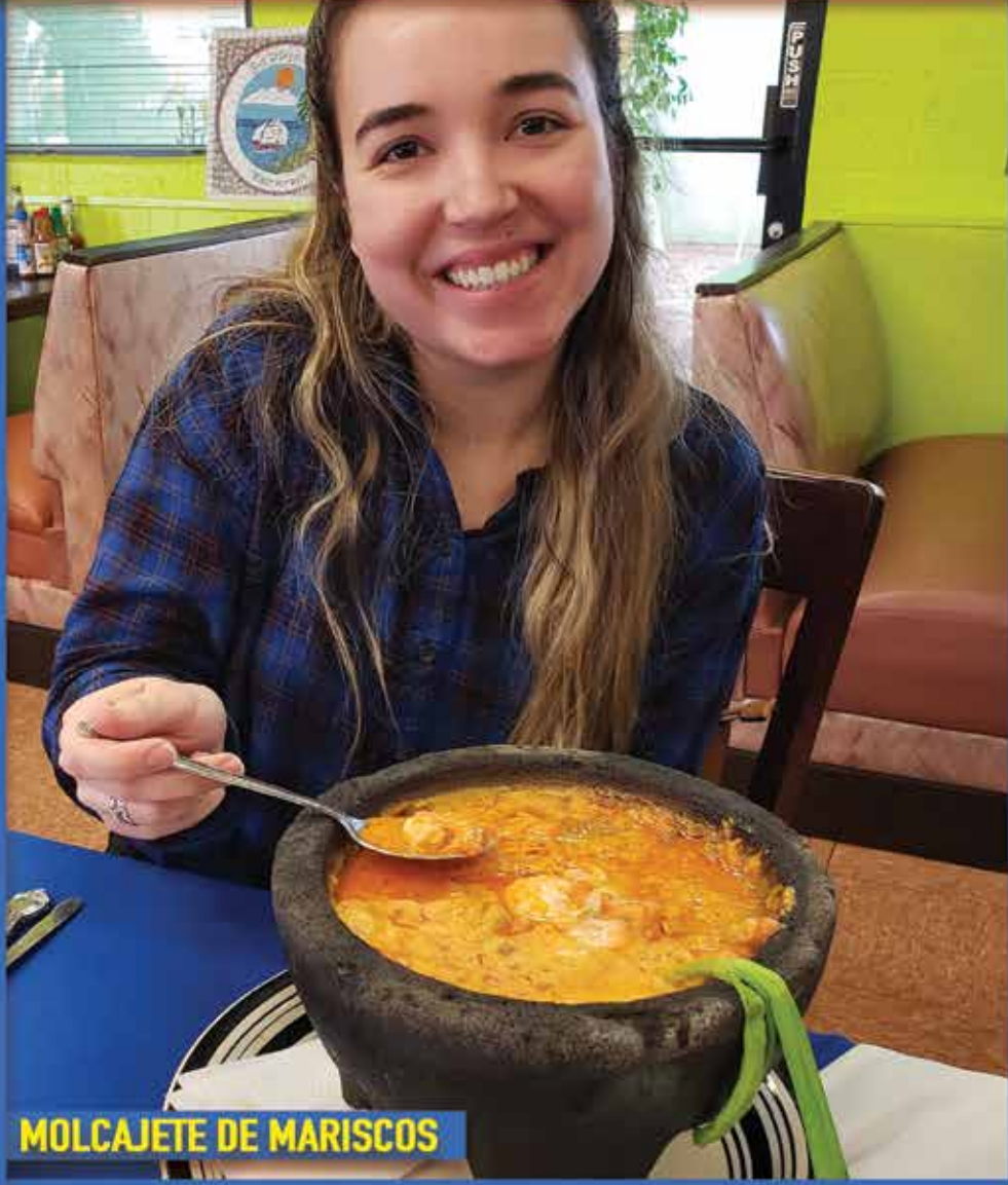
MOLCAJETE DE MARISCOS