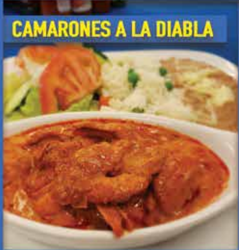
CAMARONES A LA DIABLA

ABRIMOS TODOS LOS DÍAS 9201 S. Avenida del Yaqui Guadalupe, AZ 85283