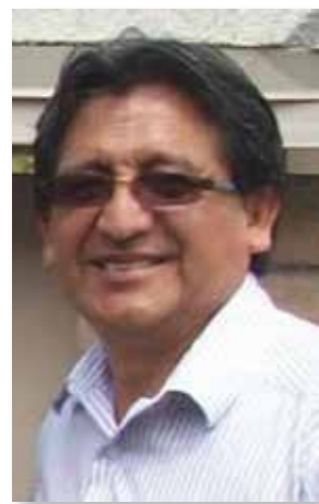
Por FRANCISCO JAUREGUI

Con motivo de la “semana del Voluntariado” en los Estados Unidos, que se celebró del 17 al 23 de abril, quisiera destacar la importancia y el impacto de dicho servicio en distintas actividades y modalidades.