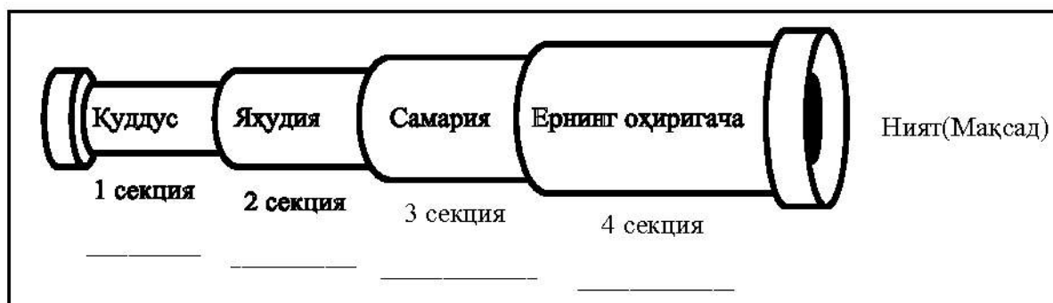
Расм.13.2. Маҳаллий жамоатни телескоплаштириш

Пастроқда чизилган (13.2) расмни кўринг. Телескопдаги ҳар бир секциядаги ажратилган жойга сиз учун қайси жойлар “Қуддус”, “Яхудия” “Самария” ва “ер юзининг чеккаси” бўлишини ёзинг. Бу секцияларнинг (жойларнинг) қайсиларида сизнинг жамоатингиз айна вақтда фаол иш олиб бормоқда? Агар сизнинг янги жамоатингиз бу соҳаларнинг бирида хизматга эга бўлмаса, аҳволни ўзгартириш учун нима қила оласиз?