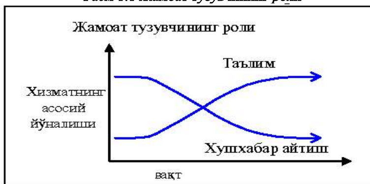
Расм 1:1 Жамоат тузувчининг роли

Хаворий Павлуснинг мактубларидан бирида, Коринфдаги жамоатни ташкил бўлиши жараёнини тасвирлаб беришини ўқиганимизда (1Кор. 3:6-10), биз жамоатлар ташкил қилиш вазифасини янада чуқурроқ ва яхшироқ тушуна бошлаймиз. Биз биламизки Павлус экди (6 оят) ва пойдевор қўйди, кейинроқ бошқа одам суғорди ва шу пойдевор устига қурди. Ҳеч ким ёлғиз ўзи жамоат ташкил қилиб, уни мустаҳкам қила олмайди — биз хизматдошлармиз (9-оят). Жамоат ташкил қилувчилар ўзгаларнинг руҳий инъомлари ва қобилиятларини ривожлантиришга ҳаракат қилишлари керак, чунки бир ўзимиз ўз вазифамизни амалга ошира олмаймиз. Биз бунинг учун керакли бўлган ҳамма инъомларга, қувватга эга эмасмиз.