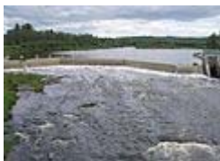
Rivière au Saumon à Scotstown.