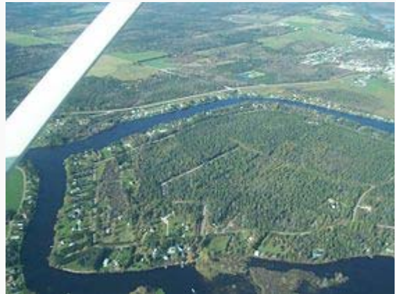
La rivière au Saumon (en bas) et la rivière Saint-François (en haut) près de Weedon .