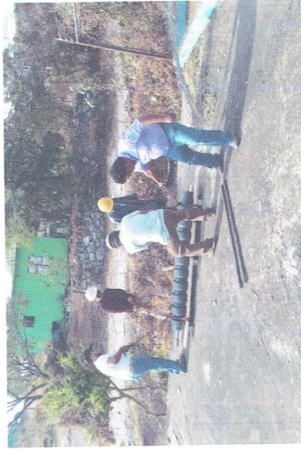
1.- SUMINISTRO DE UN CUERPO DE BOMBA VERTICAL TIPO TURBINA, 75 HP., MODELO 10ALS1.9 DESCARGA EN 6" DIA, MARCA AS PUMIS