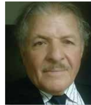
Por CÉSAR IBARRA Periodista de Prensa escrita, Radio y TV