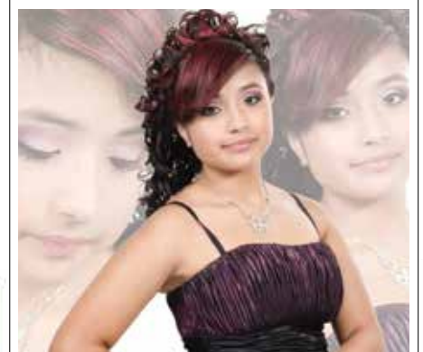
Foto y video para bodas, quinceañeras, bautizos y más 623-500-1420