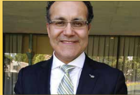
DR. Q ¡Orgullo hispano!