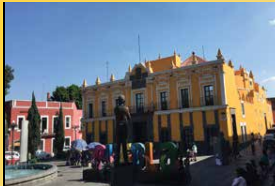
PUEBLA DE LOS ÁNGELES Destinos