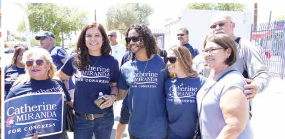
La candidata se tomó fotos con todos sus seguidores y en su discurso hizo énfasis en temas como la educación, la prevención del suicidio y el apoyo a las mujeres veteranas. ¡Empezó la competencia!