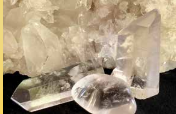
CURACIÓN CON CRISTALES ¡Sí se puede!