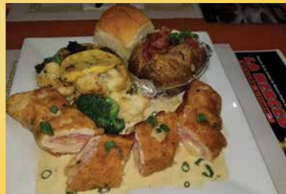
¡CENA PARA MAMÁ! Para chuparse los dedos