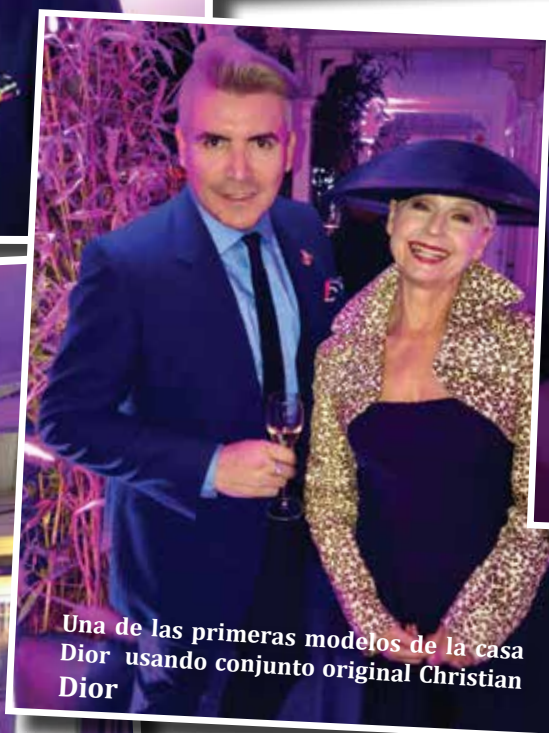
Una de las primeras modelos de la casa Dior usando conjunto original Christian Dior