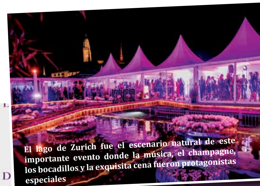
El lago de Zurich fue el escenario natural de este importante evento donde la música, el champagne, los bocadillos y la exquisita cena fueron protagonistas especiales