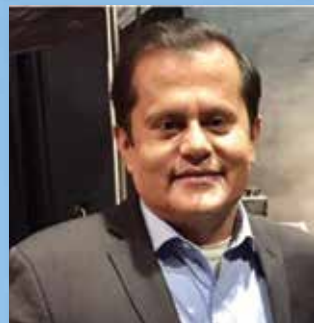
Por OSCAR GÓMEZ PERIODISTA