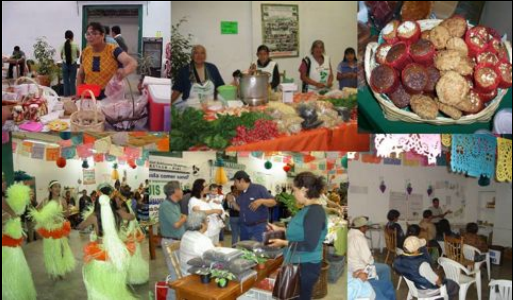
Mercados locales Organicos