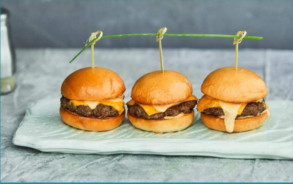
إلف برغرز 3.500 Elf Burgers