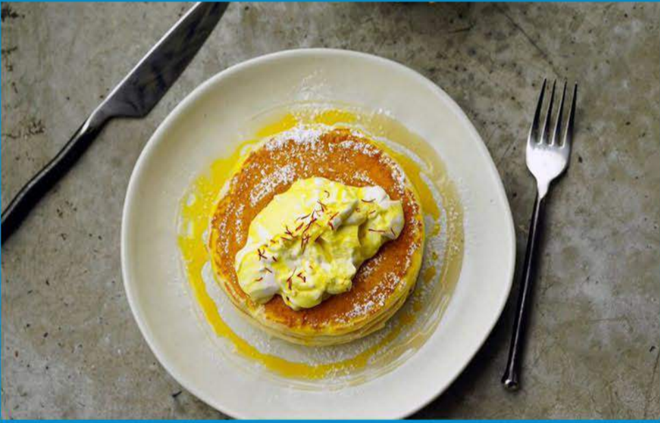
البانكيك الكويتية 4.450 Kuwaiti Pancakes