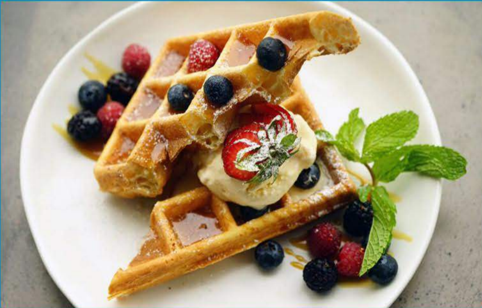
الوافل البلجيكي Belgian Waffles 3.250