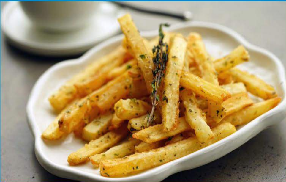
بطاطس مقلية 1.000 Potato Fries