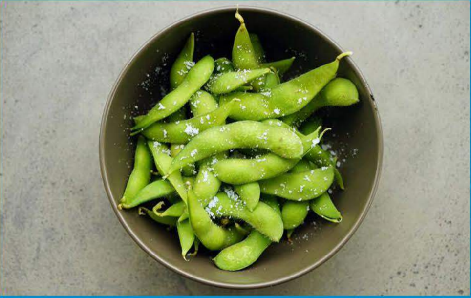
ادامامي 1.750 Edamame