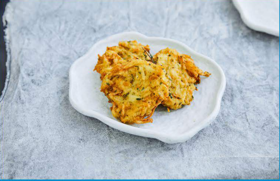
هاش براون 13 Hashbrown