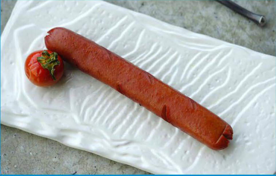
الصوصج البقري 1.000 Beef Sausage