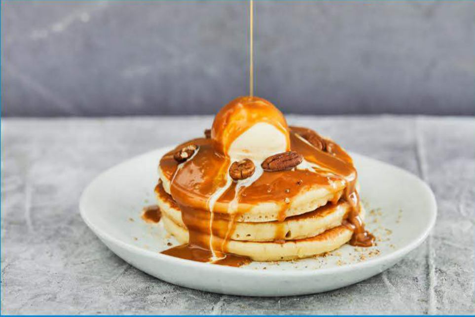
Toffee & Pecan pancakes بانكيك التوفي والبيكان 3.950