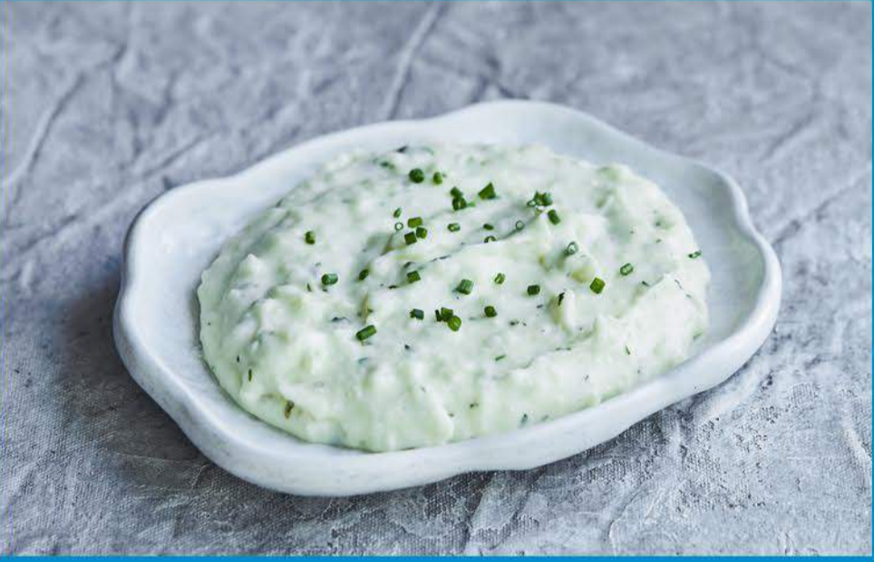
البطاطس المهروسة 1.000 Mashed Potatos