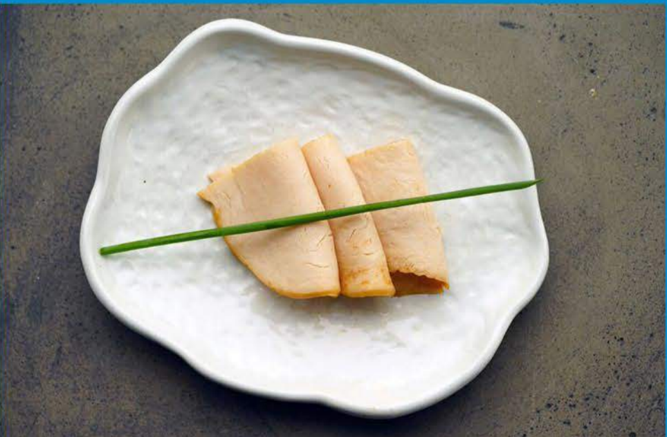
Smoked Turkey الديك الرومي المدخن 1.000