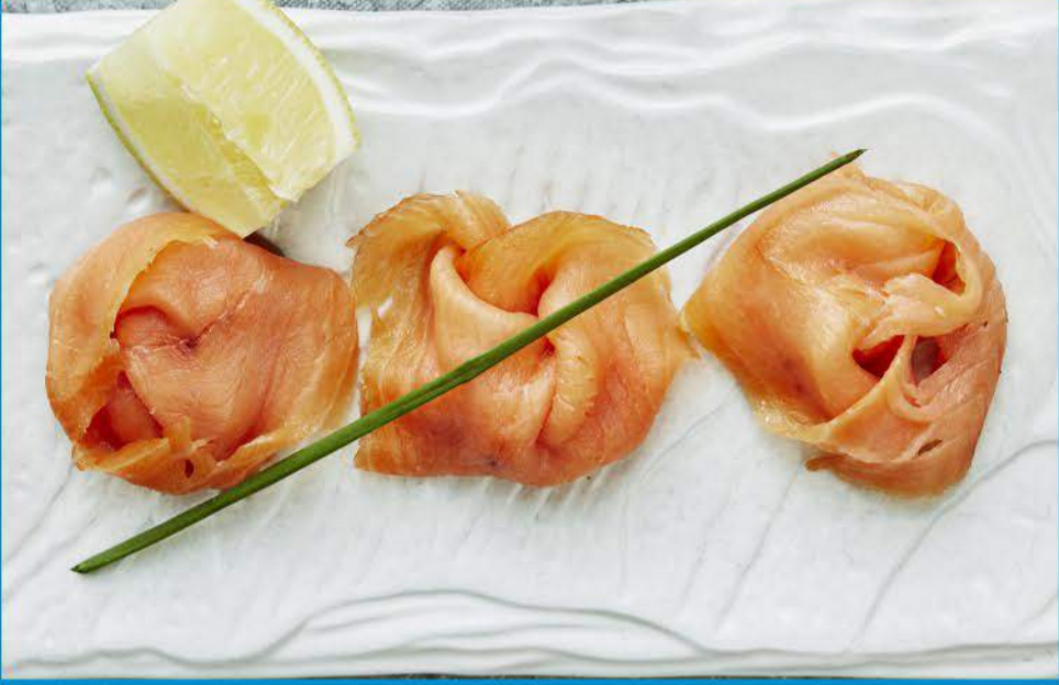
شرائح السلمون 2.500 Salmon