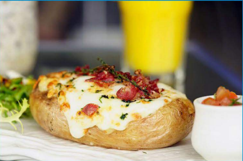
Potato Bowl البطاطا بالفرن 1.950