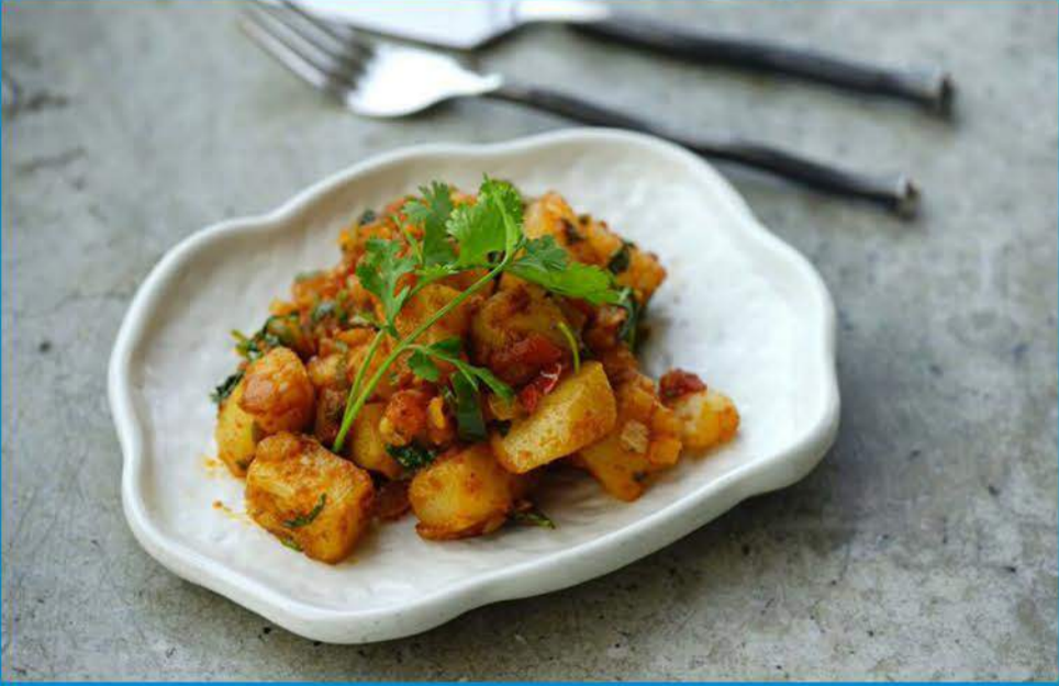
مكعبات البطاطس 1.000 Potato Cubes