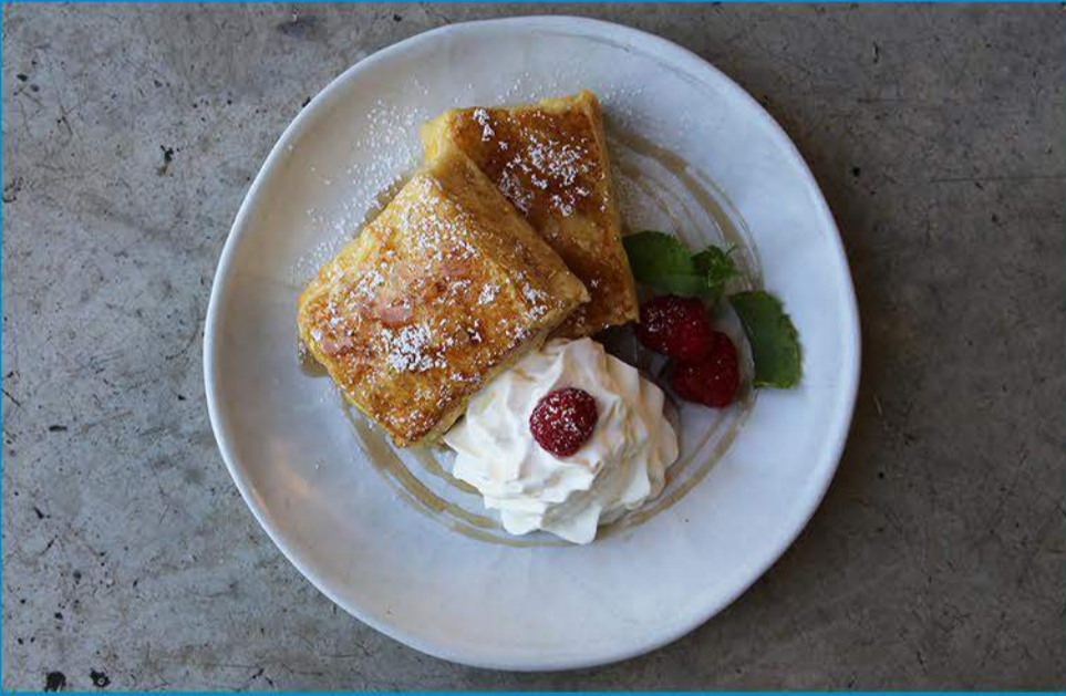
فرينشس French's 3.250