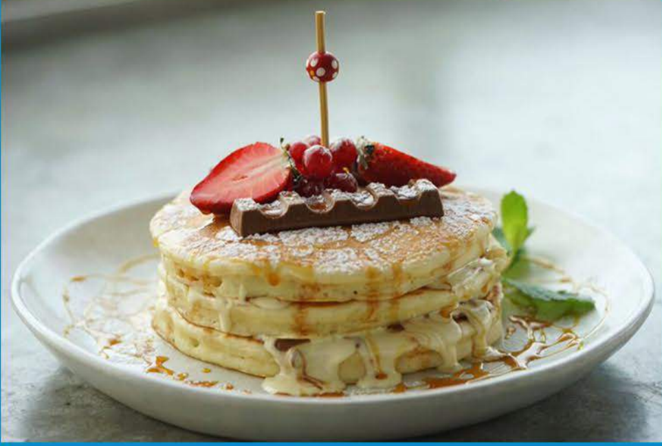
كيندر بانكيك 3.950 Kinder Pancakes