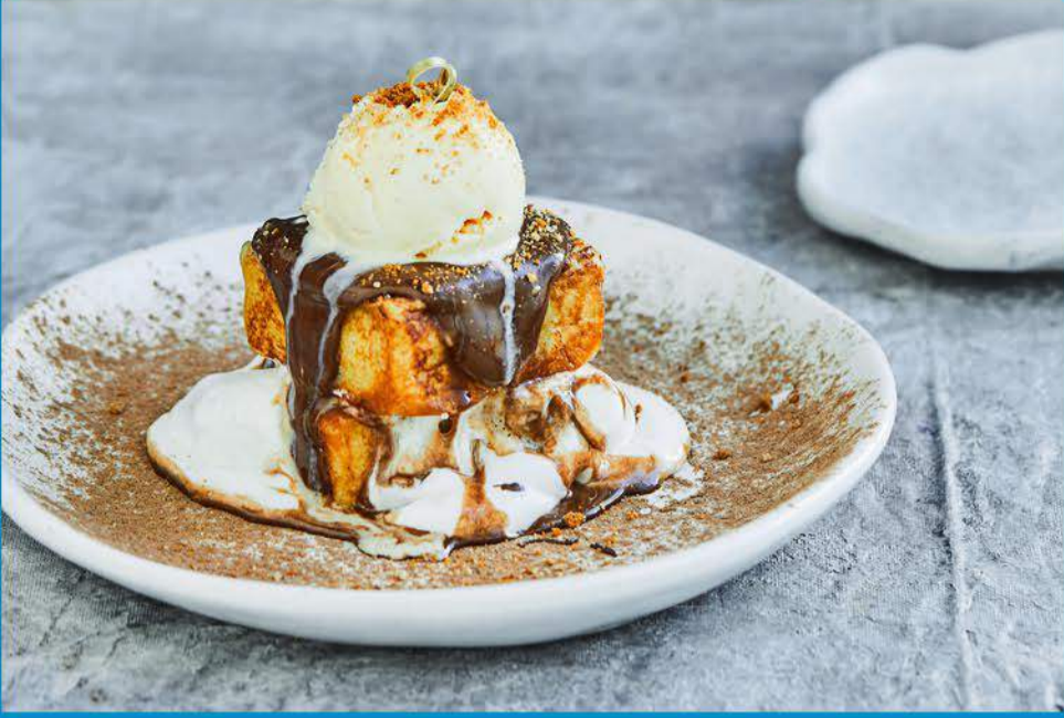
مارس & ميلو Mars & Mellow 3.450