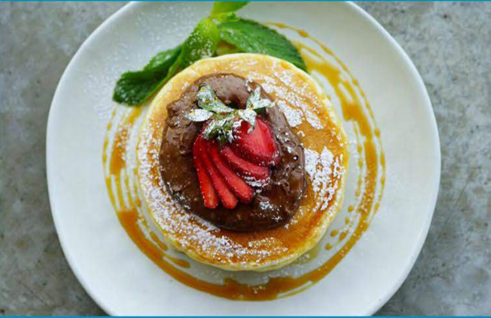
فلافي بانكيك 3.250 Fluffy Pancakes