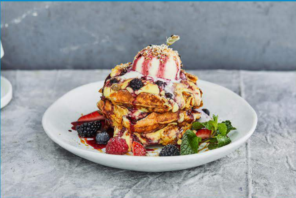
The French Waffle ذا فرينش وافل 3.950