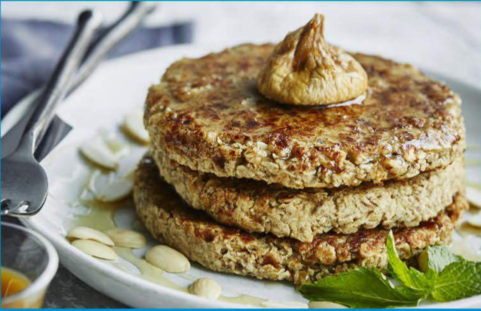
Gluten-Free Oatmeal Pancakes بانكيك الشوفان الخالي من الغلوتين 4.250