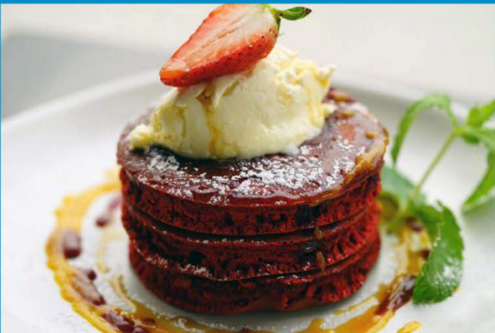
Red Velvet Pancakes