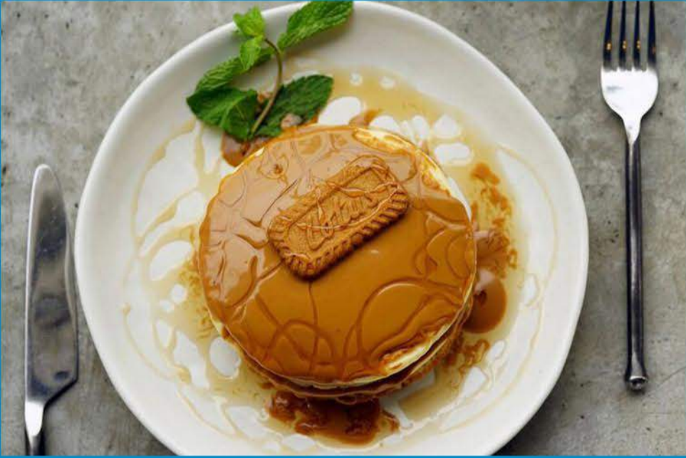
بانكيك اللوتس Lotus Pancakes 3.950