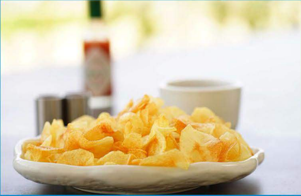
شيبس 1.000 Chips