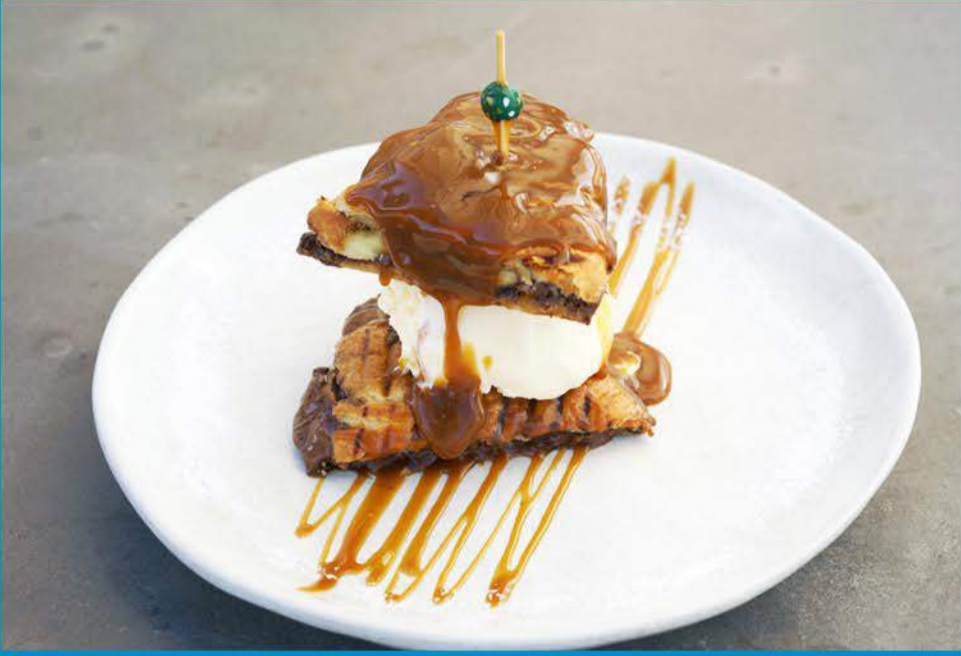
كراميل آمبوش 3.450 Caramel Ambush