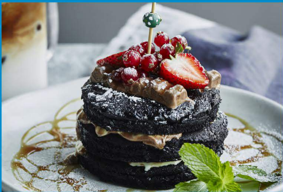
Black Velvet Pancake