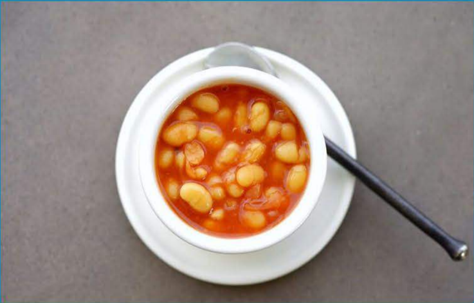
الفاصوليا المطهوه 0.300 Baked Beans