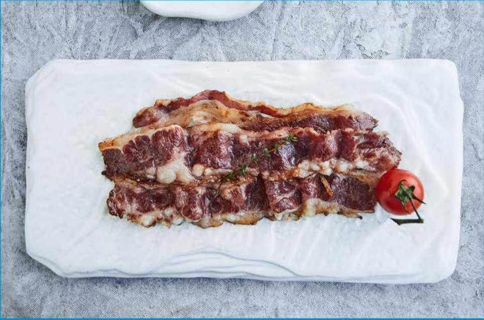
اللحم البقري المققد 1.000 Beef Bacon