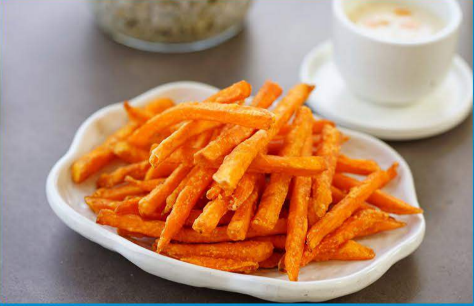
البطاطا الحلوة 1.000 Sweet Potato