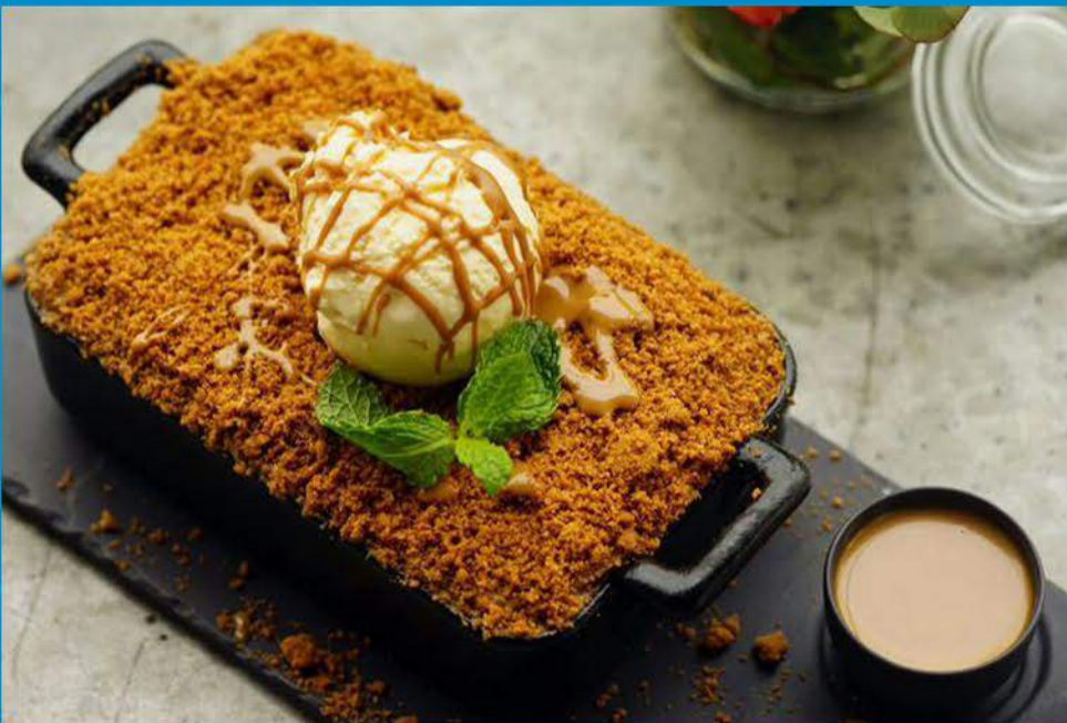
Lotus Bread Pudding