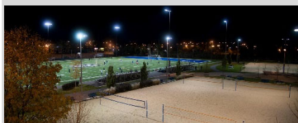
Université De Montréal - CEPsum