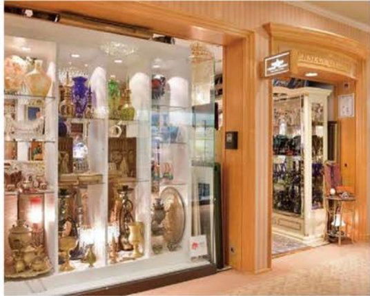
有) ペルシヤンギャラリー-帝国ホテルプラザ店 東京都千代田区内幸町 1-1-1 帝国ホテルプラザ 4F 電話: 03(3580)0070 URL: persiangallery1994.com

緊急事態宣言から9か月が過ぎようとしています。感染拡大防止に協力し、2か月間休業を余儀なくされ、今尚大変な状況です。けれども、この機会に改めて気づかされたことや、家族との貴重な時間を得られたことは有難いと感じています。コロナ予防対策には十分気を付けています。特に免疫を上げる為に、沢山笑うこと、そして皆が毎日穏やかな気持ちで過ごせるように心がけています。