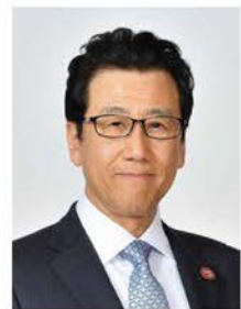
札幌市長 秋元克広

東京札幌会の皆様には、日頃から札幌市政の推進にご支援・ご協力を賜り、厚くお礼申し上げます。