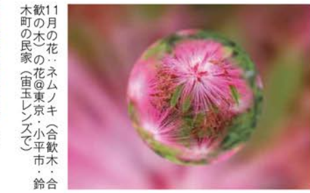
11月紅葉のライトアップ@東京・小金井公園・江戸東京たてももの園 高橋是清邸・西川家別邸・南側庭園の紅葉 11月の花・ネムノキ(合歓木・欽の木)の花@東京・小平市・鈴木町の民家(雷玉レンズ)