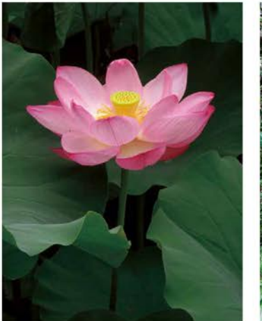
ハス(蓮)の花@2015年8月・山形県米沢市・上杉神社境内 2021年は救済の歳となりますように