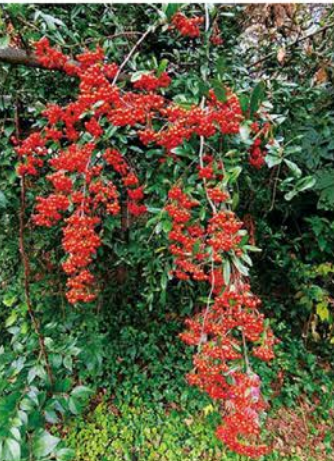
12月の花・実:ピラカンサの紅い実@東京・小平市・花小金井南町の小平グリーンロード