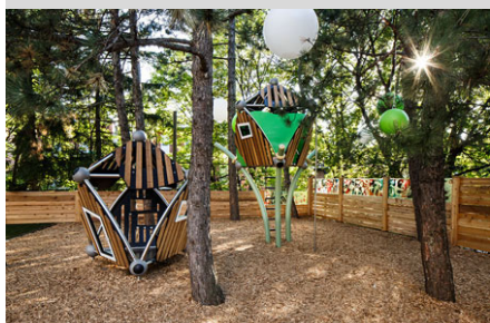
La forêt enchantée