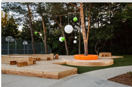
La mer des rencontres