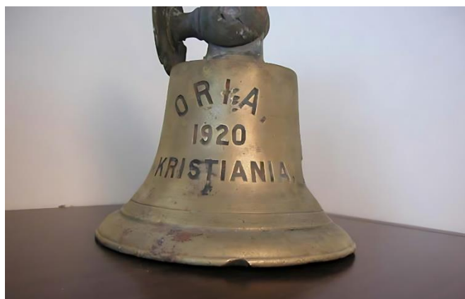
La campana del piroscafo "Oria" "Kristiania" è l'antico nome di Oslo