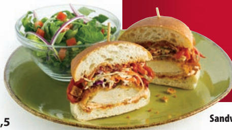
Sandwich au poulet frit

Poitrine de poulet frite bien croustillante avec notre confiture de tomates au bacon, salade de chou maison aux cornichons et notre mayonnaise au chili sur petit pain grillé. 14,5