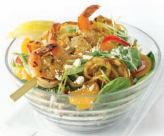
Salade aux épinards avec une brochette de crevettes grillées

Lanières de calmars frites, sauce chili, ail et sésame, poivrons rouges et verts, oignon vert et arachides avec vinaigrette Ranch. 13