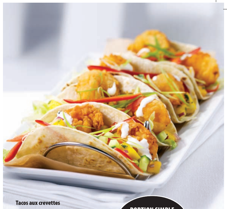
Tacos aux crevettes