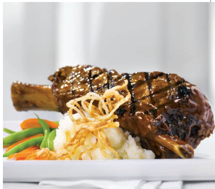
Bout de côte de bœuf (16 oz)