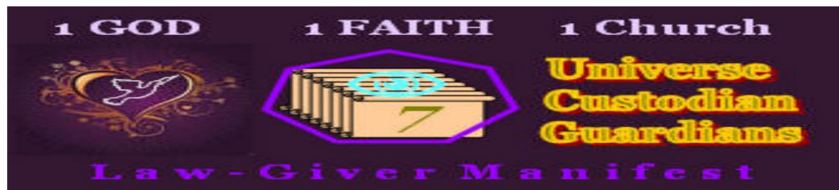
Tagapagmantala sa Tigbantay sa Tigbantay 20.01.1.1

Hunonga ang pagbasa sa giimprinta nga mga mantalaan, magasin, libro, gamita ang digital ug Save Trees! Ang pagkawalay puy-anan usa ka kapakyasan sa komunidad!