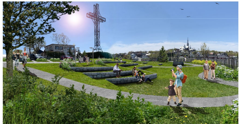
VILLE DE RIVIÈRE-DU-LOUP CONSULTATION PUBLIQUE 07 JUIN 2019