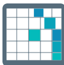
Sopa de letras