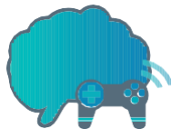
Juegos de memoria