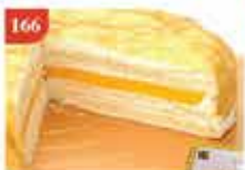
166 Touched芒果奶凍千層 蛋糕 約850g/12件 零售價-$270 會員價$158