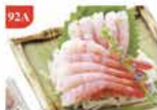
甜蝦刺身 30隻裝 零售價-$68 會員價$36