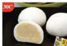
30C 馬來西亞D24榴槤大福 雪米糕 8粒 零售價-$59 會員價$45