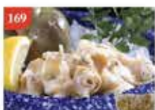
加拿大翡翠螺XL加大碼 約500g/約6-8隻 零售價-$72 會員價$48