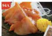
赤貝刺身 20片/約120g 零售價-$56 會員價$38