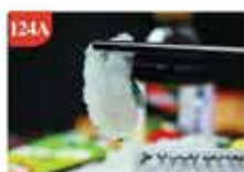
泰式生蝦刺身 約20件 零售價-$89.5 會員價$23