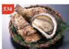
日本廣島全殼刺身級生蠔 12隻/Size M 零售價-$276 會員價$248