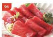
原庄吞拿魚刺身 約300g-500g 零售價-$198 會員價$148