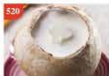
520 原個椰皇雪芭蒸鮮奶 約220g/個 零售價-$46.5 會員價$38.5