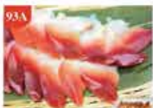
北寄貝刺身 約160g 零售價-$68 會員價$62