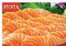
挪威原庄冰鮮三文魚柳刺身 約700g/約2kg 零售價-$198/552 會員價$148/398