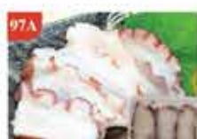
八爪魚刺身 約20片 零售價-$36 會員價$26