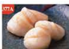
日本帶子刺身 約250g/約16-18隻 零售價-$128 會員價$98