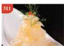
日本水母刺身 約60g 零售價-$66 會員價$42