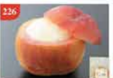
226 日本原個水蜜桃雪芭 約160g 零售價-$43.5 會員價$37