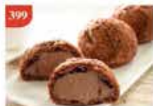
399 日本朱古力泡芙 12件 零售價-$32 會員價$21