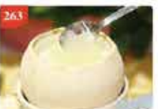
263 泰國原個海茶椰王凍 約220g 零售價-$41.5 會員價$38.5