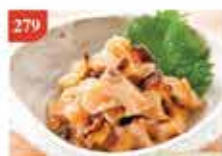
榮螺刺身片 約100g/約20件 零售價-$46 會員價$32