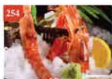
原隻阿根廷特大紅蝦XL (刺身用) 約500g/12-15隻 零售價-$123 會員價$78