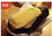
568 日本LISE原個蕃薯雪芭 約100g 零售價-$43 會員價$38