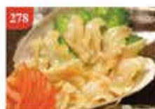
馬刀貝刺身片 約120g/約20件 零售價-$89 會員價$38