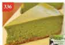
336 日本GoYoi宇治抹茶芝士 蛋糕 約4件 零售價-$89.5 會員價$49.5