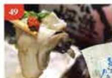
日本廣島去殼刺身生蠔 約1kg/Size L/約36-45隻 零售價-$278 會員價$159