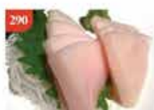
原庄劍魚腩刺身 約300g-500g 零售價-$68 會員價$65