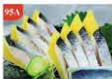
希魯魚子刺身 約120g 零售價-$365 會員價$27