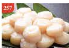
日本北海道帶子刺身(L) 大碼 約500g/約10-12隻 零售價-$266 會員價$198