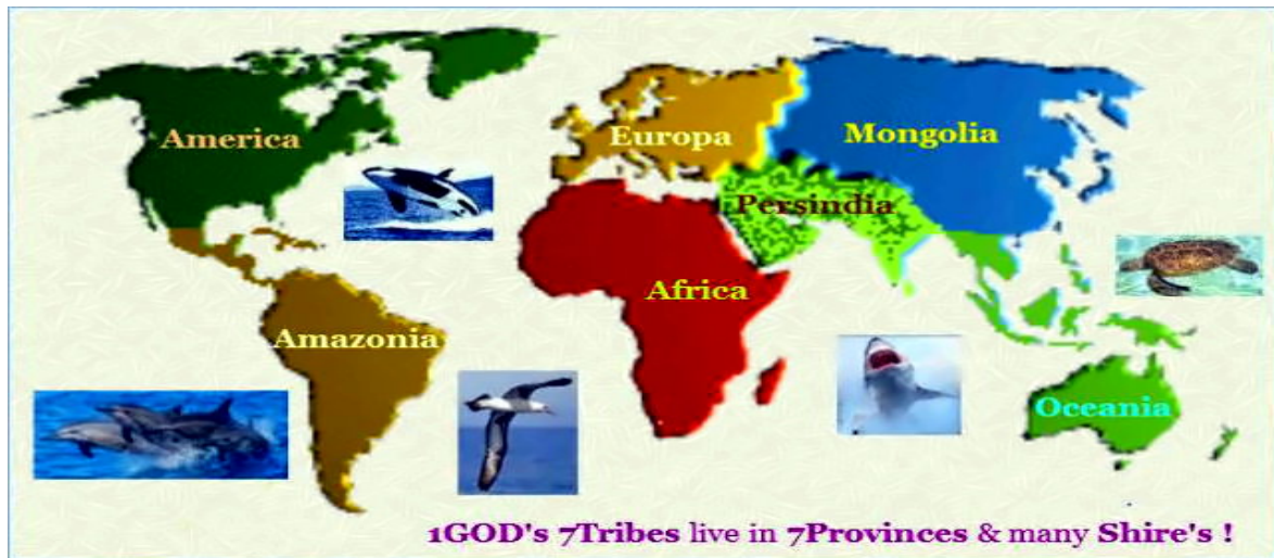
1GOD's 7Tribes live in 7Provinces & many Shire's !

UCG1စကြာဝဠာအုပ်ထိန်းသူများ၊ ၁ ဘုရားသခင်'၊ ၁ ယုံကြည်ခြင်း'၊ 1 ဘုရား ကျောင်း! UCG1နံပါတ်(၁-၇)၊ Orackle ၏အမိန့်ကိုပြသပါ။