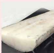
574. 美國白鱈魚連皮魚尾扒 約227g-250g 零售價：$108 會員價$89.5