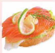
42A. 挪威煙燻三文魚(鮭魚) 切片 約100g 零售價: $39 會員價$29.5