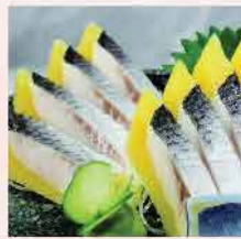
95A. 希靈魚子刺身 約120g 零售價：$38.5 會員價$27