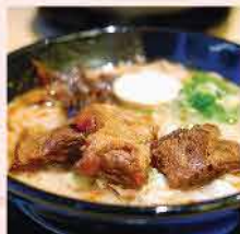
340. 日式味附豬軟骨(熟) 約500g 零售價: $89 會員價$62