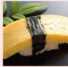
575. 東洋和風玉子燒(壽司蛋) 約500g 零售價：$36 會員價$28