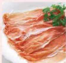
7. (熟) 煙燻油花牛肉片 約500g 零售價: $128 會員價$69.5