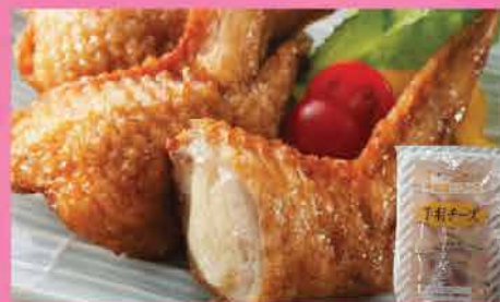
62. 日式芝士雞翼 約500g 零售價：$165 會員價$78