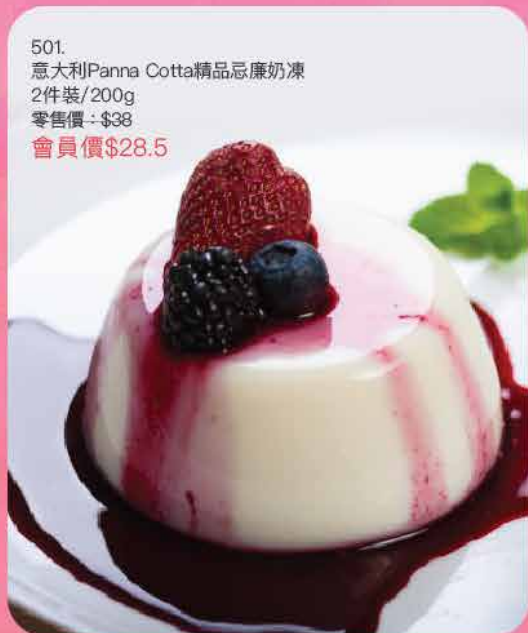
501. 意大利Panna Cotta精品忌廉奶凍 2件裝/200g 零售價: $38 會員價$28.5