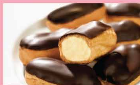
114. 迷你朱古力脆皮忌廉巴夫條 約160g/10個 零售價: $48 會員價$30.5