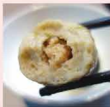
461. "山葵"包心丸 約300g 零售價: $57 會員價$28.5