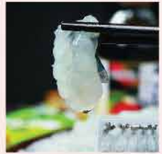
124A. 泰式生蝦刺身 約20件 零售價: $69.5 會員價$23