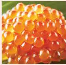
75. 日本青森縣三文魚籽-醬油漬 約80g 零售價：$128 會員價$98