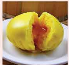
588. 蛋黃黃金流沙包 (馬來西亞製造) 8件裝 零售價: $39.5 會員價$34.5