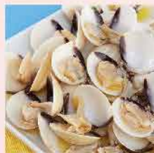
496. 越南白蚶(熟) 約500g 零售價：$36 會員價$26