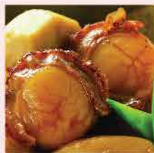
393. 日本太子貝2S 約300g 零售價：$56 會員價$29.8