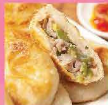
137. 台灣宜蘭蔥肉餡餅 約900g/30件 零售價：$89 會員價$58