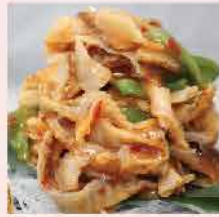
131. 日式味付帶子裙邊 約500g 零售價：$92 會員價$58