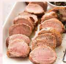
539. 荷蘭天然豬特價套裝: 荷蘭天然梅頭豬上肉(約500g) 荷蘭天然肉眼豬扒(約500g) 荷蘭天然一級去皮五花腩(約500g) 零售價: $129 會員價$100