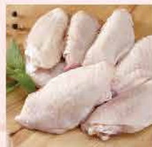
506. 紐西蘭WATO A天然無激素走地"雞中翼" 約400g/約10隻 零售價: $68 會員價$54.5