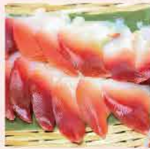
93A. 北寄貝刺身 約160g 零售價：$98 會員價$62