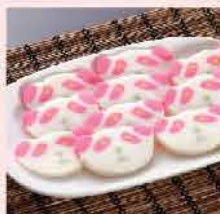
280. 小流熊日式魚蛋片 約300g/約28件 零售價: $37 會員價$26