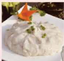
160. 金牌墨魚滑(香港製造) 約150g 零售價: $43 會員價$38