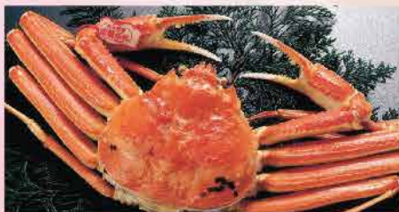
71A. 北海道原隻松葉蟹(熟) 約550g 零售價: $210 會員價$178