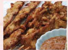
38. 馬來西亞沙嗲烤雞串燒 約140g/一包6串 零售價: $36 會員價$28