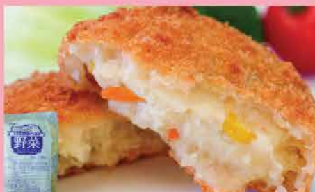
54. DV野菜薯餅 約650g 零售價：$89 會員價$57