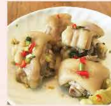
548. 泰辣秘製酸辣豬手 約454g 零售價: $48 會員價$42