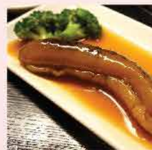
571. 南美急凍天然海參 約1磅 零售價：$132 會員價$96