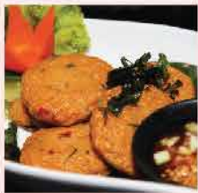
46. 泰國Sifco泰式魚餅 約400g/約20件 零售價：$58 會員價$38