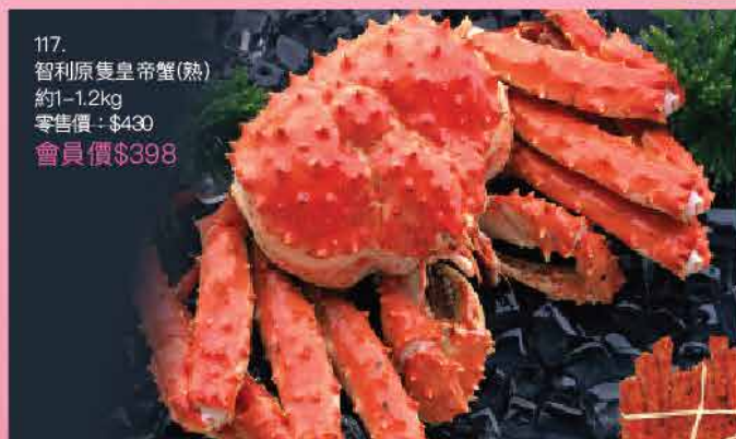
117. 智利原隻皇帝蟹(熟) 約1-1.2kg 零售價: $430 會員價$398