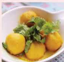
101B. 新界鮮味炸魚旦 約300g 零售價: $34 會員價$26