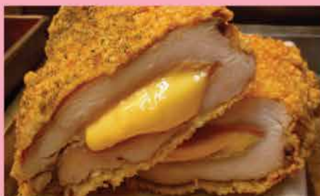
135. 台北士林吉列芝心雞扒 5件 零售價：$89 會員價$69.5