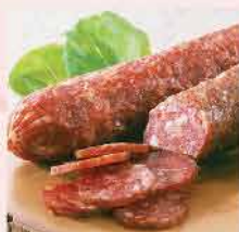
14. Auntie Claire(熟)意大利辣肉腸(牛肉) 約500g 零售價: $83 會員價$64