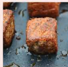
583. 精選一口吞拿魚柳(須熟食) 約1Kg 零售價：$525 會員價$46.5