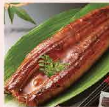
91. 日式蒲燒鰻魚 約280g-300g 零售價：$108 會員價$79.5