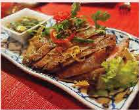
243. 泰式豬頸肉 1磅/約15-18小片 零售價: $68 會員價$48