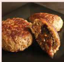
544. 紐西蘭焦糖洋蔥漢堡 8件/880g 零售價: $158 會員價$132