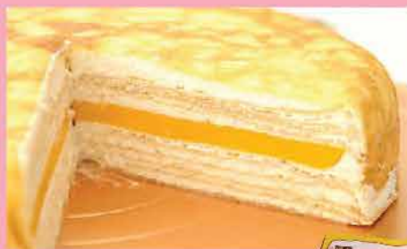
166. Touched芒果奶凍千層蛋糕 約850g/12件 零售價: $270 會員價$158