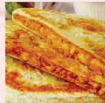
319. 馬來西亞Kawan咖喱鍋餅 約400g/4片 零售價: $39 會員價$29