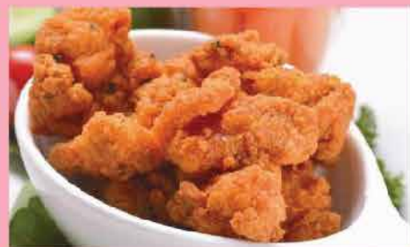
404. 韓式炸辣味雞塊 約500g 零售價：$68 會員價49