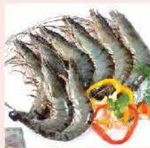
79B. 越南有頭虎蝦(L) 約300g 零售價：$78 會員價$48