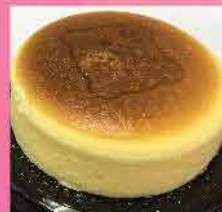
591. 香港烘焙芝士蛋糕 約300g 零售價: $98 會員價$78