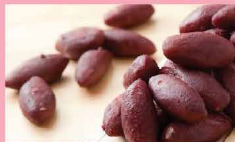
127A. 日本迷你燒甜薯 約50粒 零售價：$69 會員價$48