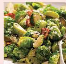
581. 比利時椰菜仔 約1Kg 零售價: $32 會員價$23