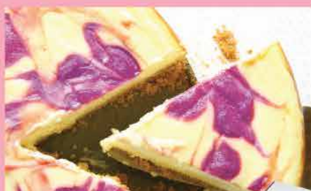
48D. 美國原裝空運入口檸檬藍莓芝士蛋糕 約720g 零售價: $298 會員價$189