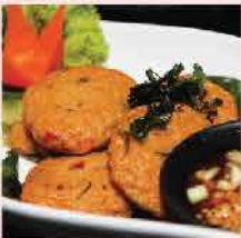
145. 泰國Sifco泰式魚餅 約400g/約20件 零售價: $58 會員價$38