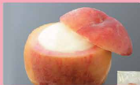
226. 日本原個水蜜桃雪葩 約160g 零售價: $48.5 會員價$37