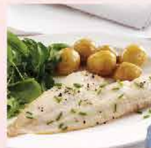
143. 澳洲一級白肉龍利柳(稔魚柳) 約480g 零售價：$68 會員價$38