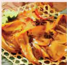
245. 咖哩原隻魷魚翼 1磅/約3-4小件 零售價：$38 會員價$36