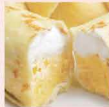
122. 馬來西亞榴槤班戟 約150g/6件 零售價: $78 會員價$48