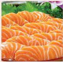
37/37A. 挪威原庄冰鮮三文魚柳刺身 約700g/約2kg 零售價：$198/552 會員價$148/398