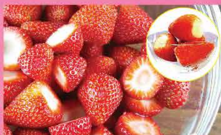
276. 日本原個草莓雪葩 約6粒 零售價: $56.5 會員價$39.5