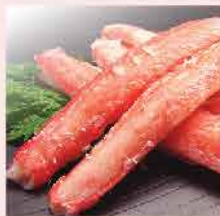
57. 大吉松葉蟹棒 約270g/約30件 零售價：$62 會員價$38