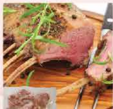
105. 精選優質法式切件羊架 約454g/約4-6件 零售價: $146 會員價$89.5