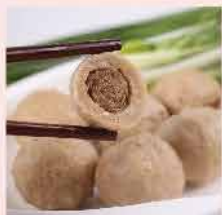
462. 麻辣湯包 約300g 零售價: $60 會員價$29.5