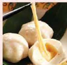
444. 拉絲芝心包 約300g 零售價: $57 會員價$28.5