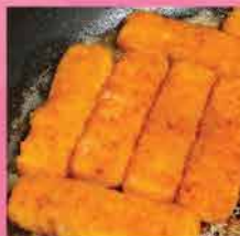
58. 吉列炸魚手指 約1kg/約40件 零售價：$112 會員價$87