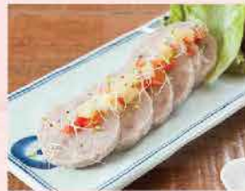
24A. 越南扎肉(原味) 約250g 零售價: $32 會員價$26