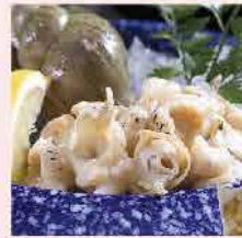
169. 加拿大翡翠螺XL加大碼 約500g/約6-8隻 零售價：$72 會員價$48