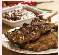
577. 馬來沙嗲牛柳串(生) 6串 零售價: $42 會員價$36