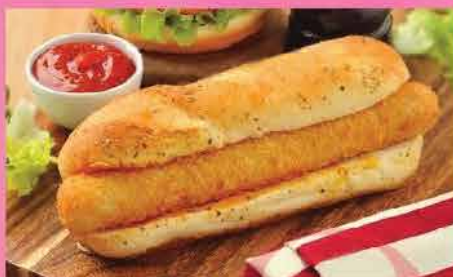
561. 炸蝦熱狗棒 5件裝/約300g 零售價：$64 會員價$48