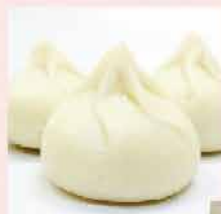
281. 特式魚蛋小籠包 約227g 零售價: $37 會員價$26