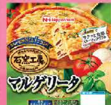
497. 瑪格麗特披薩 直徑約23cm/約185g 零售價：$55 會員價$42.5