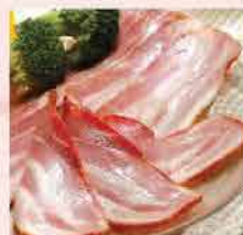
66B. 優質煙肉(瘦腩片) 約1磅裝 零售價: $48 會員價$35