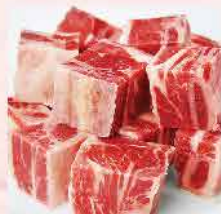
406. 日本鹿兒島一口豚 約500g 零售價: $122 會員價$58