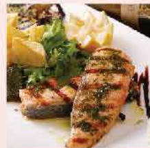
220. 挪威有機連皮三文魚柳 約500g/約4pcs 零售價：$140 會員價$108