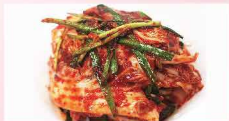
572A. 韓國傳統地道泡菜 約500g 零售價: $39.8 會員價$46.8