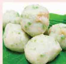
445A. 翡翠杏菇球 約300g 零售價: $34 會員價$26