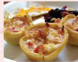
552. 泰式冬蔭炸蝦羹 約10件 零售價: $48 會員價$42