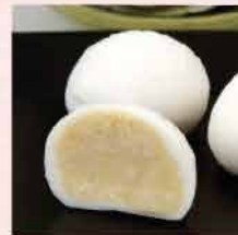
30A. 馬來西亞D24 榴蓮雪糯米糍 約240g/8件 零售價: $68 會員價$45