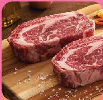
592. US美國極級Prime Grade Ribeye厚切 肉眼扒 約12安士 零售價: $128 會員價$108