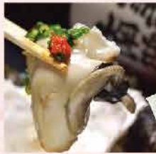
49. 日本廣島去殼刺身生蠔 Size L 約1kg/約36-45隻 零售價：$278 會員價$159