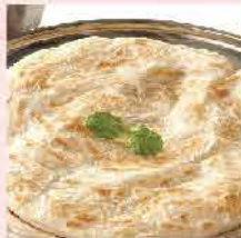
318. 馬來西亞Kawan油酥餅(原 味)(黃金烙餅) 約400g(5片) 零售價: $32 會員價$24