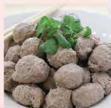
590. 安格斯西冷特爽牛丸(馬來西亞製造) 約250g/12-14粒 零售價: $49.8 會員價$36.8