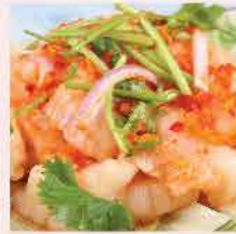
323A. 泰辣去骨酸辣瓜(熟) 約300g 零售價: $58 會員價$49.5