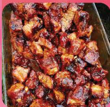
595. 西班牙黑毛豬杜洛克豬軟骨(生) 約330g 零售價: $39.5 會員價$32