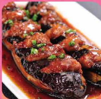
593. 鮮炸蝦膠藤茄子(熟) 約360g 零售價: $76 會員價$64