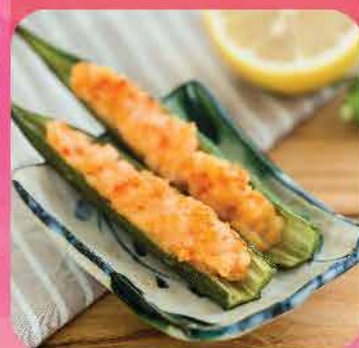
594. 蒸煮蝦肉釀秋葵(熟) 約500g 零售價: $84 會員價$72

尚有更多食品，請登入： www.auntieclaire.com.hk 免除店鋪的昂貴租金，客人可直接選購食品，並能配送到指定地址， 質量既提高，成本又降低，比團購更優惠、更可靠、更方便。誠意為本港市民服務。