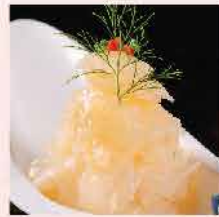
311. 日本水母刺身 約60g 零售價：$66 會員價$42