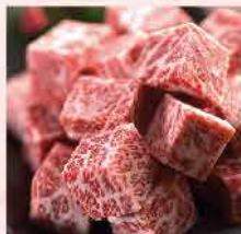
102. 日本霜降一口牛肉身 約454g 零售價: $133.5 會員價$69.5