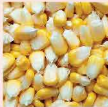
589. 馬來西亞原粒剝落粟米 (非刀切) 約500g 零售價: $328 會員價$23.8