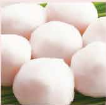
15. 馬來彈口鮮魚丸 約500g 零售價: $378 會員價$28