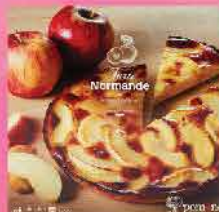
499. 法國諾曼第士忌廉蘋果批 約450g 零售價: $98 會員價$74.5