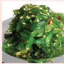
99. 中華沙律 約500g 零售價：$50 會員價$35