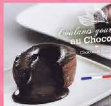
458. 法國心太軟蛋糕 約100g/2件 零售價: $68 會員價$38