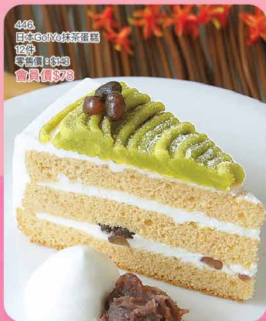
446. 日本GoYo抹茶蛋糕 12件 零售價: $148 會員價$78