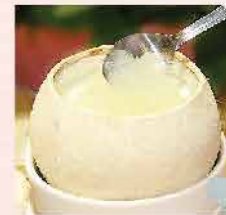
263. 泰國原個海蒸椰王凍 約220g 零售價: $41.5 會員價$38.5