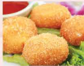
164. 泰國泰式炸蝦餅 16件 零售價: $42 會員價$29.5