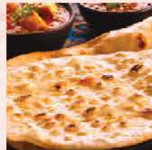
320. 馬來西亞Kawan原味印度 烤包 約425g/5片 零售價: $39 會員價$29