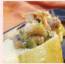
182. 芥辣八爪魚 約250g 零售價：$83 會員價$56