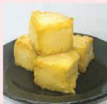
479. 濃芝士豆腐 約300g/約15粒 零售價: $42 會員價$33