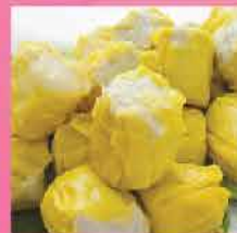
247. 魚肉燒賣 約454g 零售價：$33 會員價$10.8