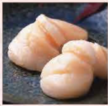
377A. 日本帶子刺身 約250g/約16-18隻 零售價：$128 會員價$98