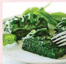
582. 精選菠菜葉 約1Kg 零售價: $38.5 會員價$29.5