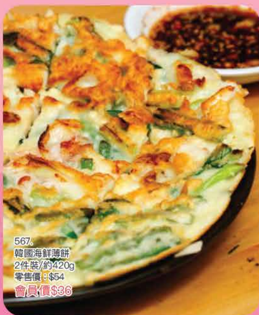
567. 韓國海鮮薄餅 2件裝/約420g 零售價：$54 會員價$36