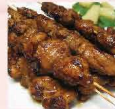
576. 馬來沙嗲豬柳串(生) 6串 零售價: $38 會員價$32