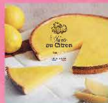
500. 法國清香檸檬撻 約450g 零售價: $89 會員價$68.5