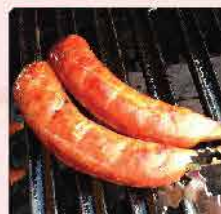
211. 日式雞骨豬肉腸 約200g/5條 零售價: $38 會員價$26