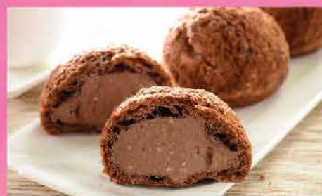
399. 日本朱古力泡芙 12件裝 零售價: $32 會員價$21