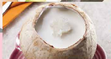
520. 原價椰皇雪燕嫩鮮奶 約220g/個 零售價: $46.5 會員價$38.5