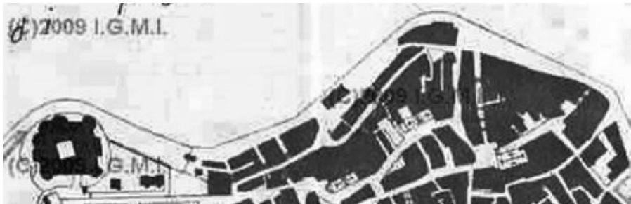
Fig.11: Pianta della Città di Brindisi a Scala 1/4000 di A. Urbani - Dettaglio 1916