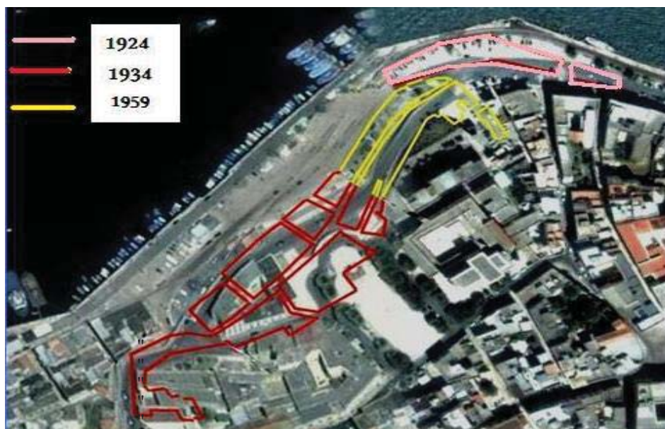
Fig.18: Le tre ondate demolitrici delle Sciabiche