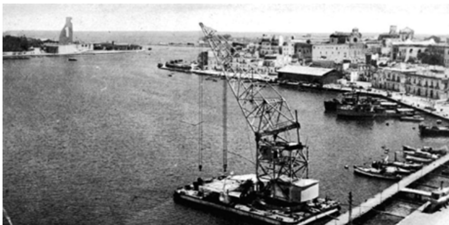
Fig.12: Panoramica dal seno di ponente con Monumento g'Stazione torpediniere e Sciabiche -1934