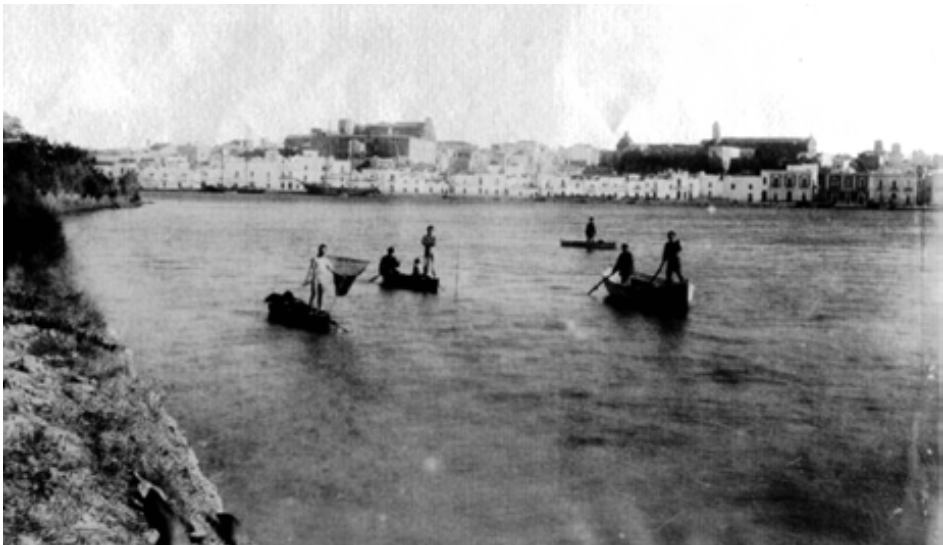
Fig.9: Brindisi: Grande panorama generale dal mare 1890