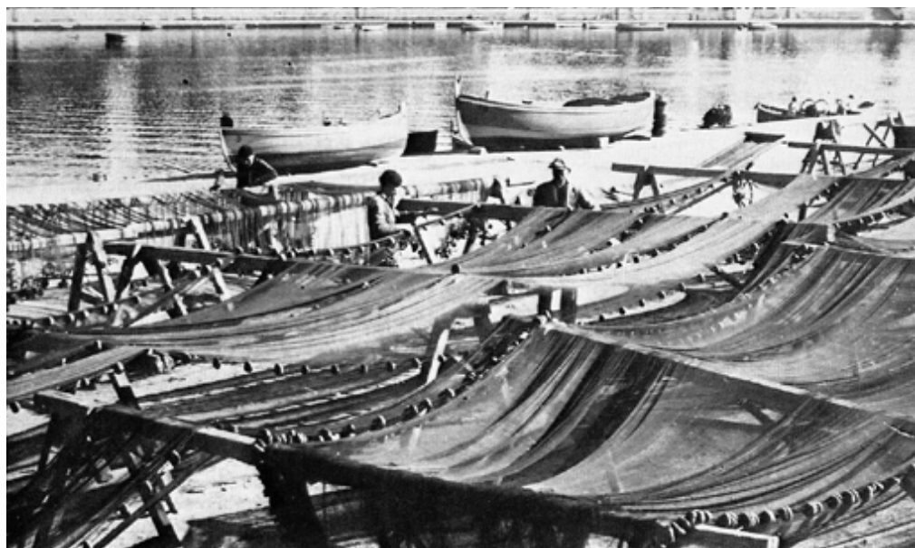
Fig.1: Le sciabiche - Da: Toponomastica brindisina del centro storico Alberto Del Sordo, 1988

Oggi, delle «Sciabiche» e degli «Sciabbicoti» non ci resta che un ricordo, piú o meno vago, dipendendo per ognuno di noi dalla propria età anagrafica o dalla lucidità con cui la nostra memoria ci riporta e ci ripropone quei due termini con i quali i nostri nonni e i nostri genitori continuarono, e qualcuno di loro persino continua ancora, ad identificare rispettivamente il rione ed i suoi abitanti.