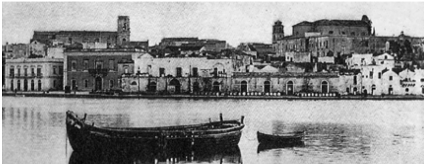
Fig.6: Il lungomare – 1915