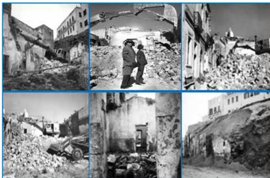
Fig.17: La demolizione delle Sciabiche: Ultimo atto 1959