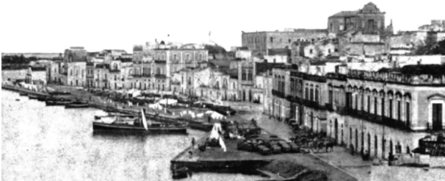
Fig.10: Panoramica delle Sciabiche 1910