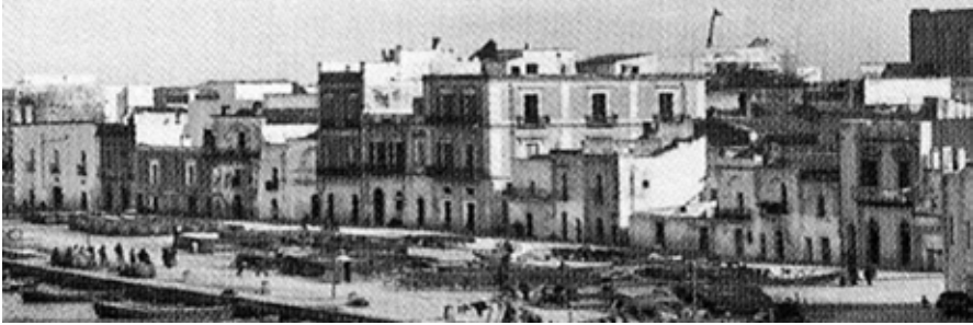
Fig.14: Le Sciabiche nel 1908. Tratta del lungomare con i caseggiati demoliti tra 1934 e 1936