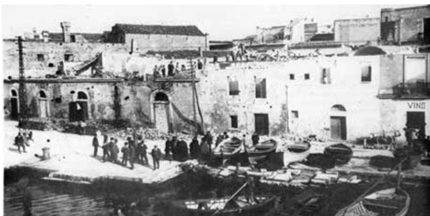
Fig.13: Caseggiati sul lungomare sradicati con le prime demolizioni 3; 46"circa