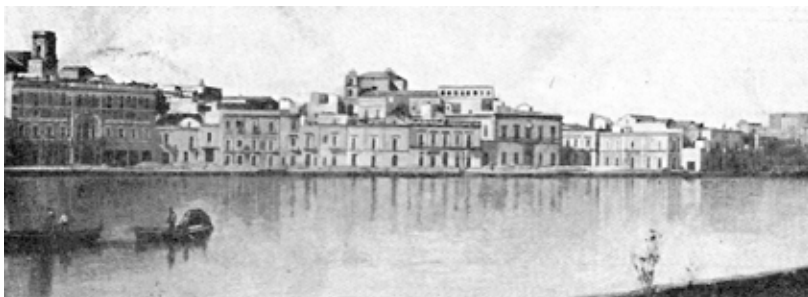
Fig.7: Il lungomare – 1905