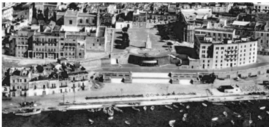
Fig.16: Le Sciabiche: la fontana imperiale, la risistemata piazza Santa Teresa e il piazzale Lenio Flacco