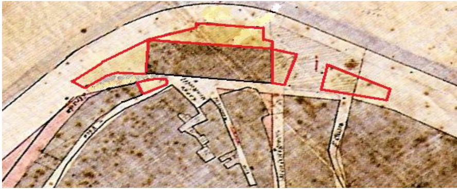
.....Fig.5: Piano regolatore della Città di Brindisi del 1883 "Dettaglio con le demolizioni previste