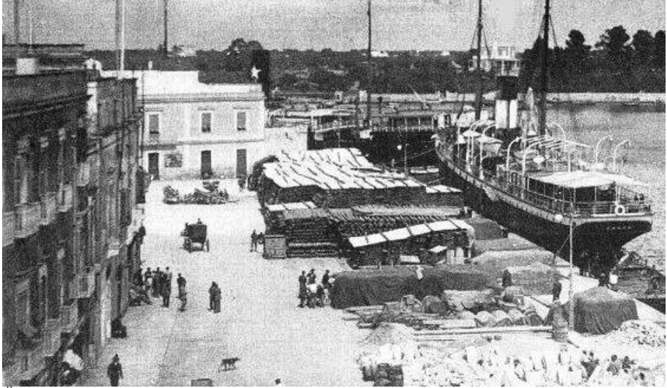
Fig.8: La strada Marina: Al fondo piazza Baccarini con la fontana dei delfini 1908