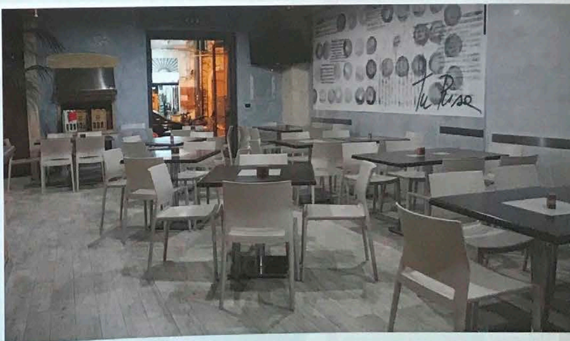
L'interno del ristorante Gruit di via Carmine

E così, abbiamo scoperto alcuni degli usi meno immaginabili che la modernità ha riservato agli ex conventi brindisini degli Agostiniani e delle Clarisse. E il futuro? Chissà cosa ha deciso riservare per l'ex convento delle monache nere di clausura di San Benedetto: c'è solo da sperare che, comunque, sia qualcosa di meglio che il suo ormai pluriennale abbandono! E per gli altri ex conventi brindisini?