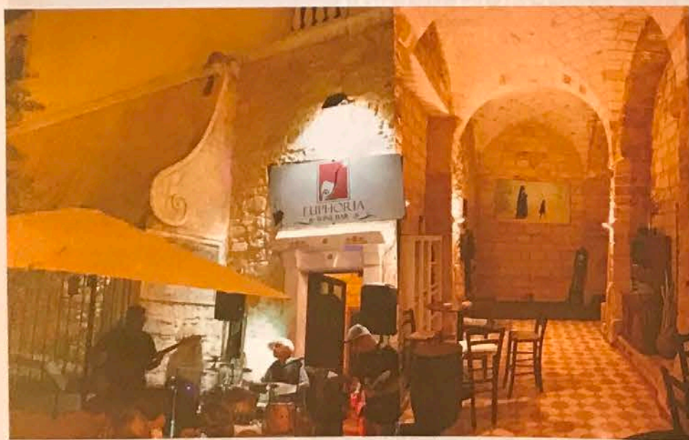
L'Euphoria occupa alcuni dei locali dell'ex convento degli Agostiniani

Hanno rappresentato, dal Cinquecento in poi, il fulcro di una parte della vita sociale ed economica della città Breve viaggio tra quello che è stato e quello che rimane: quasi nulla