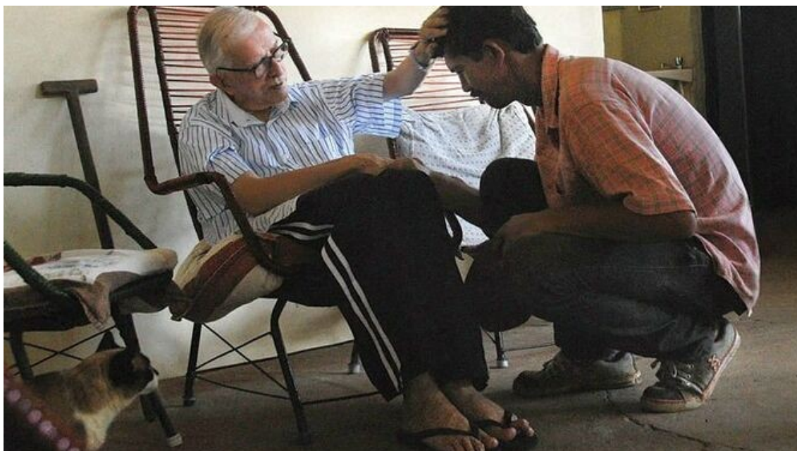
Casaldàliga y un campesino Adital

guatemalteca, la salvadoreña. A todas acompañó, visitando a sus líderes, poniéndose del lado de los pueblos en lucha y celebrando con ellos la liberación.