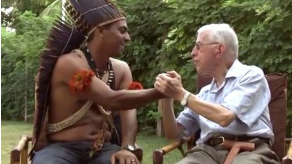
Casaldáliga, valiente, honesto

9. Profeta. Siguiendo las huellas de los profetas de Israel/Palestina, de Jesús de Nazaret y de Bartolomé de Las Casas , Pedro despertó las conciencias adormecidas, revolucionó las mentes instaladas, denunció las injusticias del sistema y anunció Otro Mundo Posible en la historia.