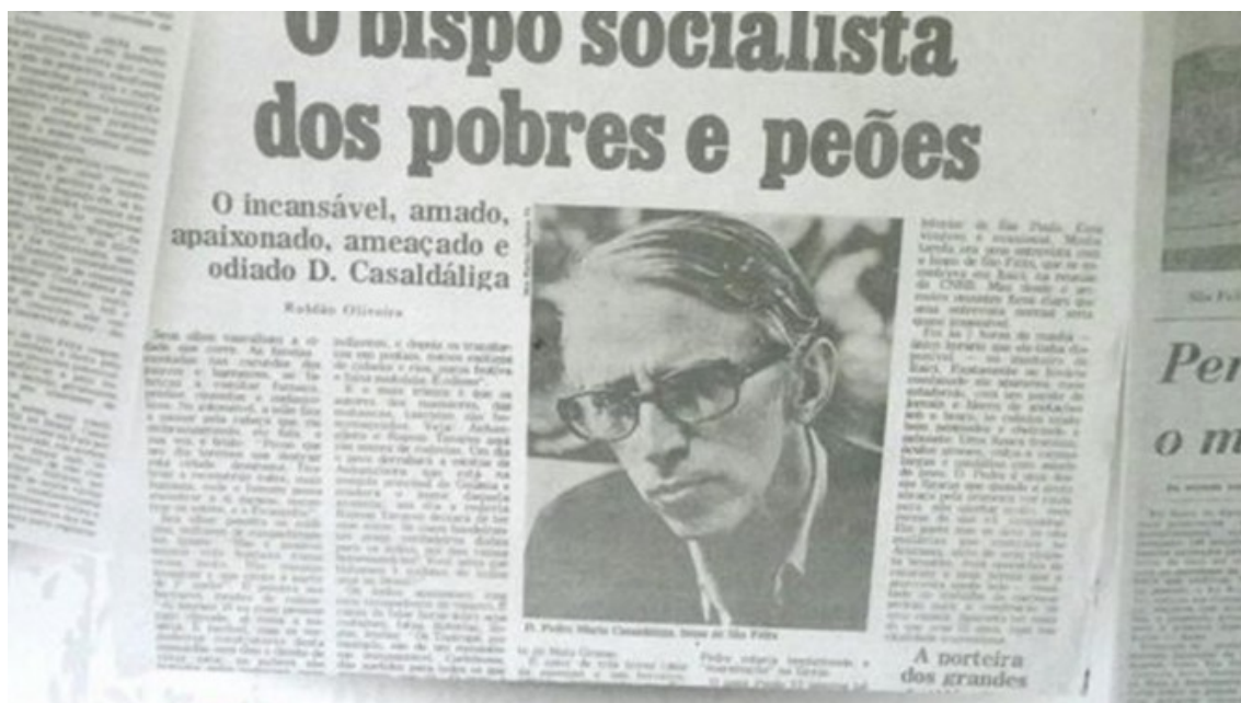
Casaldàliga en un recorte de prensa

desactivada, en esta hora de pragmatismo, de productividad, de mercantilismo total, de posmodernidad escarmentada” y se declaró obrero de la utopía en construcción y a rehabilitar críticamente a contratiempo. Utopía como lugar “donde quepamos todos”, como piden los zapatistas mayas. Su mensaje fue “de esperanza en esperanza caminamos esperanzándonos”.