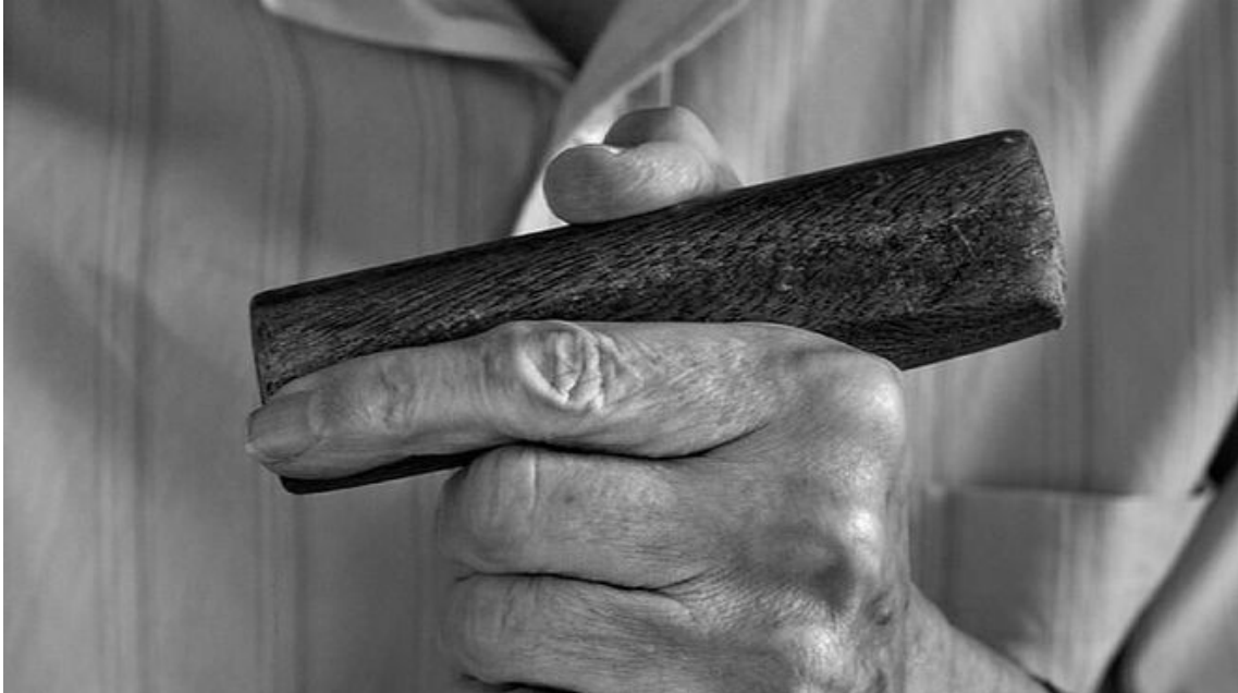
Las manos de Casaldáliga Joan Guerrero

"Ninguna causa que se jugara en la esfera local o internacional le era ajena, tampoco ninguna revolución"