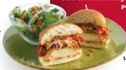
Sandwich au poulet frit

Demi-sandwich multigrain à la dinde avec soupe aux poivrons rouges rôtis et petite salade César ou petite salade resto, au choix. 13,5