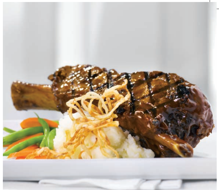
Bout de côte de bœuf (16 oz)