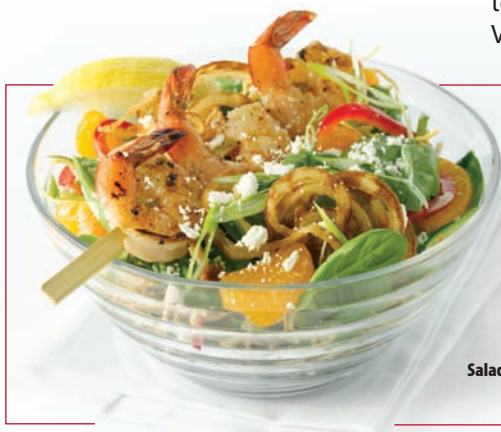
Salade aux épinards avec une brochette de crevettes grillées