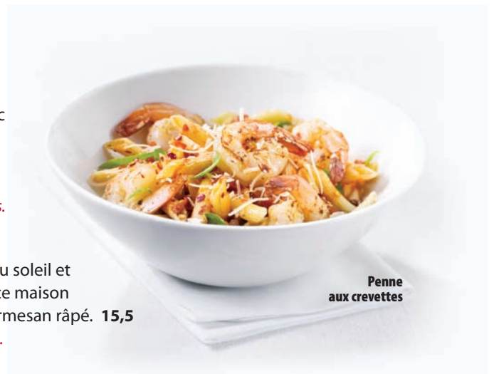
Penne aux crevettes

Filet de morue en pâte maison à la bière avec salade de chou maison, sauce tartare et frites fraîches. 14