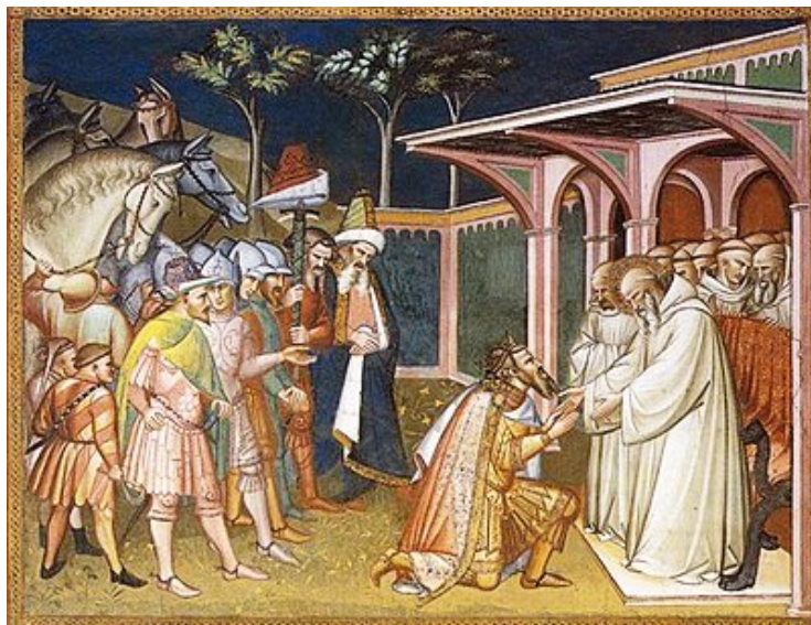
Totila incontra san Benedetto. Affresco di Spinello Aretino, in San Miniato al Monte, Firenze

Di fatto, l’avvento dei Bizantini conseguente alla guerra greco-gotica – con il fiscalismo eccessivo, con lo spopolamento delle campagne per le inumane condizioni di vita dei contadini, con le vie terrestri di comunicazione mantenute insicure e quasi impraticabili, con il declassamento del porto a favore di quello otrantino, e quant’altro – per Brindisi inaugurò una profonda depressione che, iniziata in quel periodo, rimarrà costante per più di quattro secoli, fino alla fine del primo millennio, fino al cese definitivo del dominio bizantino e all’arrivo di quello dei Normanni, con l’incorporazione della città al nuovo stato unitario del Meridione italiano: il regno di Sicilia.