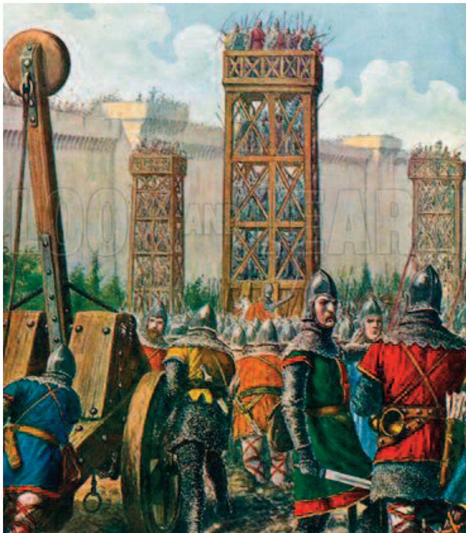
Belisario assedia Roma nel 536. Nella pagina accanto Giustiniano e la sua corte in un mosaico

Se dunque la causa dell'indubbio profondo e prolungato decadimento che soffrì Brindisi nei secoli che seguirono a quell'evento bellico non fu tutta semplice e diretta conseguenza della guerra, e se inoltre – come è ben documentato anche da Cassiodoro – quel decadimento non si era manifestato prima dell'evento e magari – come farebbe presumere la “Pragmatica Sanctio” emanata da Giustiniano alla fine della guerra – neanche immediatamente dopo, allora