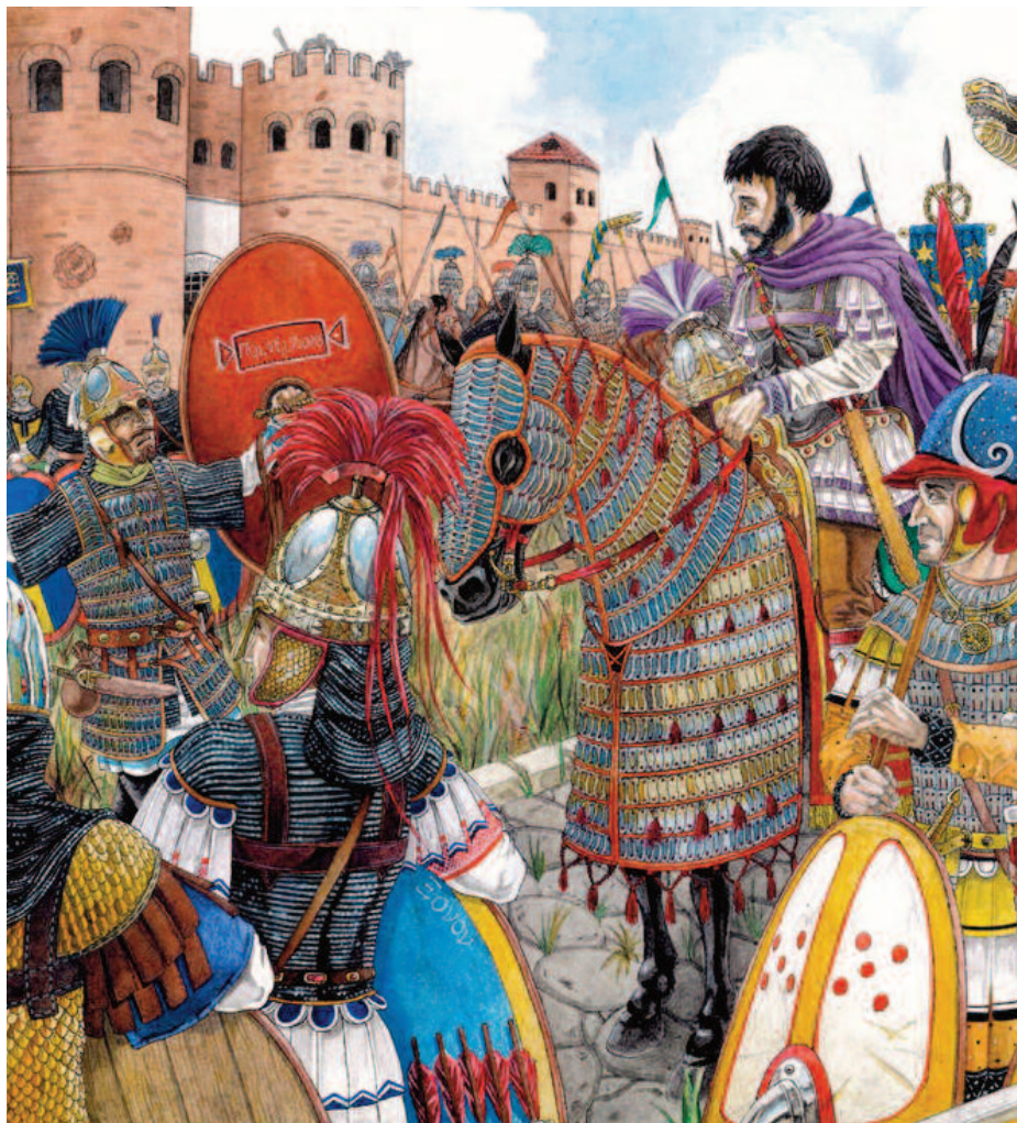
Belisario, a cavallo, conquista Roma nel 536. Nella pagina accanto il re goto Totila

Belisario non riuscì a liberare Roma dall'assedio di Totila e questi il 17 dicembre del 546 – corrotte le sentinelle della Porta Asinaria – penetrò in città mentre i Greci già stremati dall'assedio, imprevedevano una disordinata fuga. Quindi, lasciato in Roma un limitato contingente di forze, Totila si diresse verso Sud per affrontare le forze del generale Giovanni. Que-