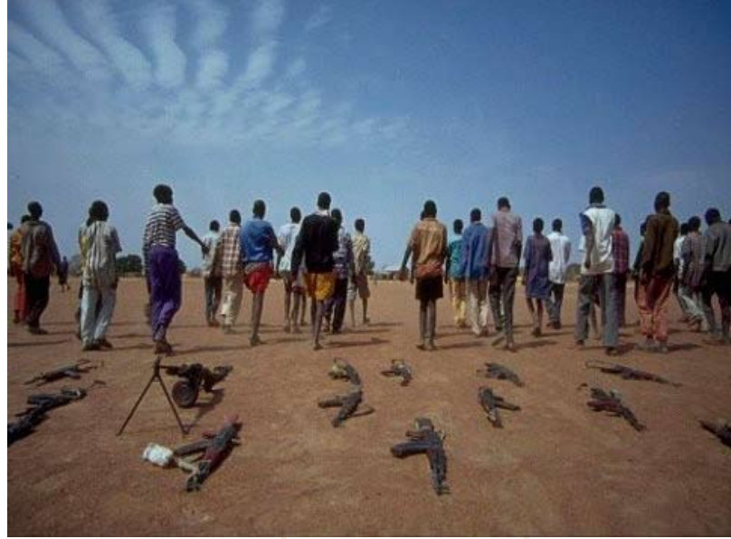
Child soldiers walking away.